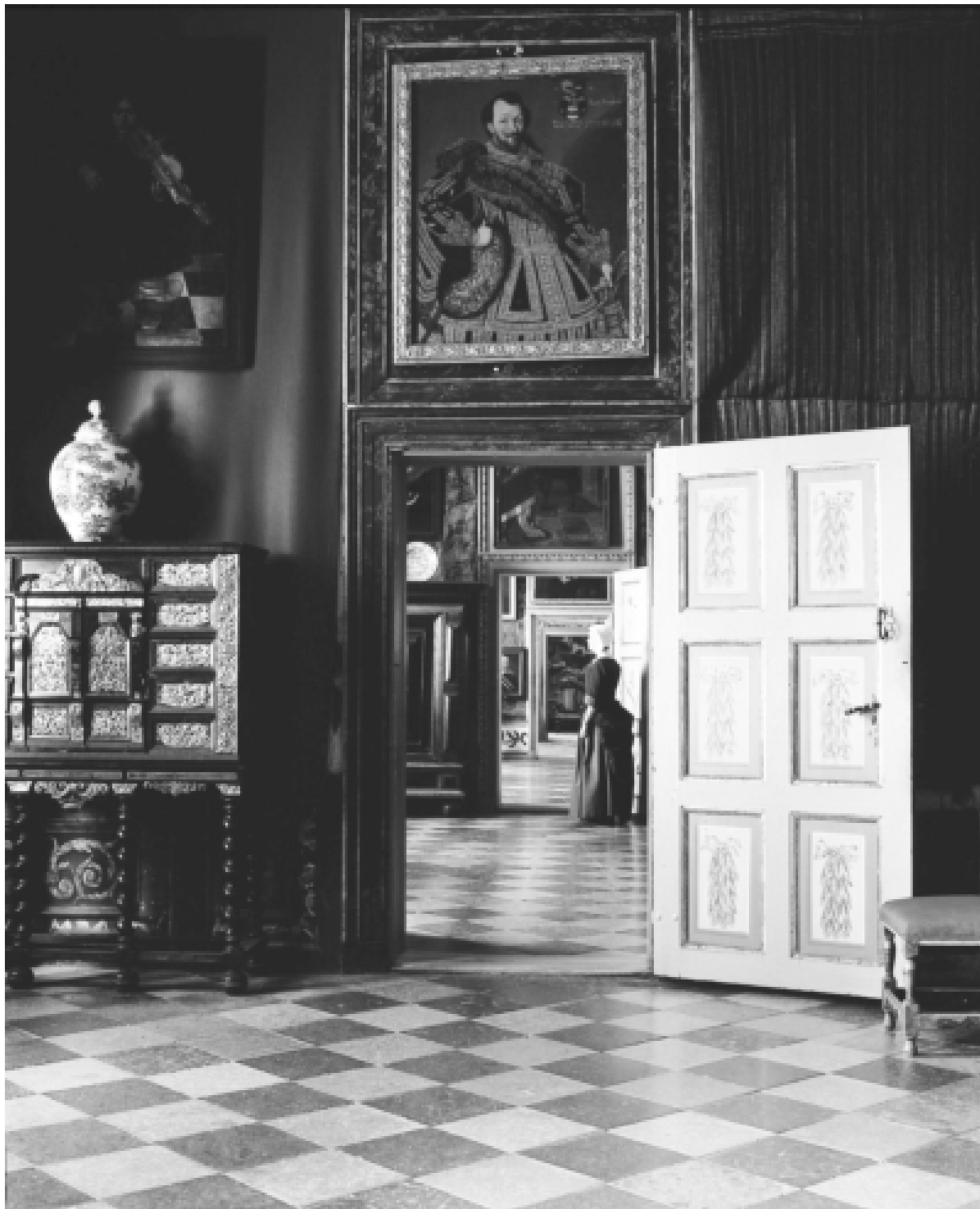
Skokloster som miljömuseum: I det dunkla släpljuset skimrar kabinettskåpens mässingsreliefer och elfenbensfaner på ett sätt som står mycket nära det intryck slottsgemaken måste ha gjort på besökare för trehundra år sedan.