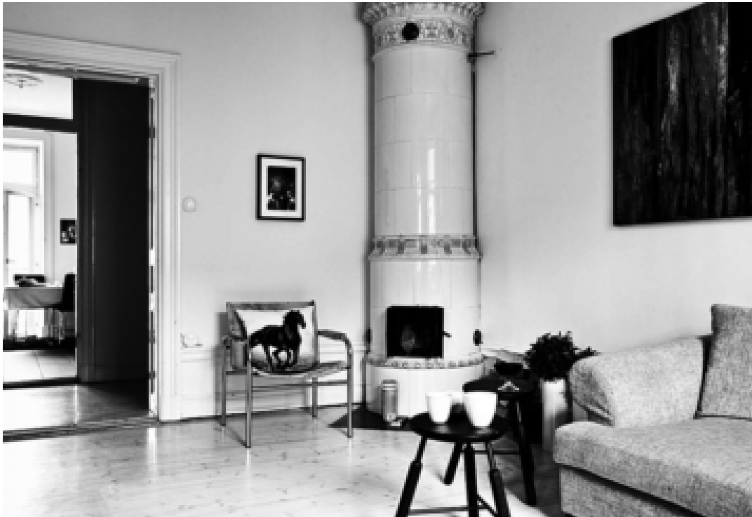
Bilden visar upp en tillrättalagd och vitmålad sekelskiftesdröm där moderna möbler och designklassiker samsas med bevarade snickerier och en ornamenterad kakelugn.