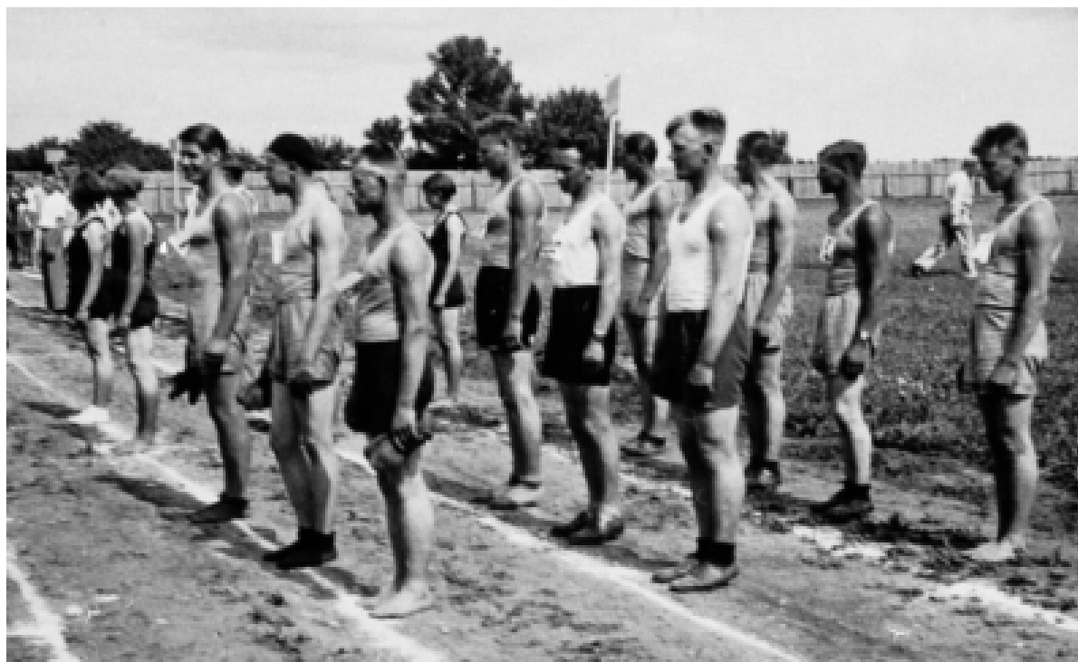
Den estlandssvenska idrottstruppen vid distriktsmästerskapen i Märjamaa 1938.

Sporten – idrottens tidsskede för estlandssvensk ungdom har brutit in”.