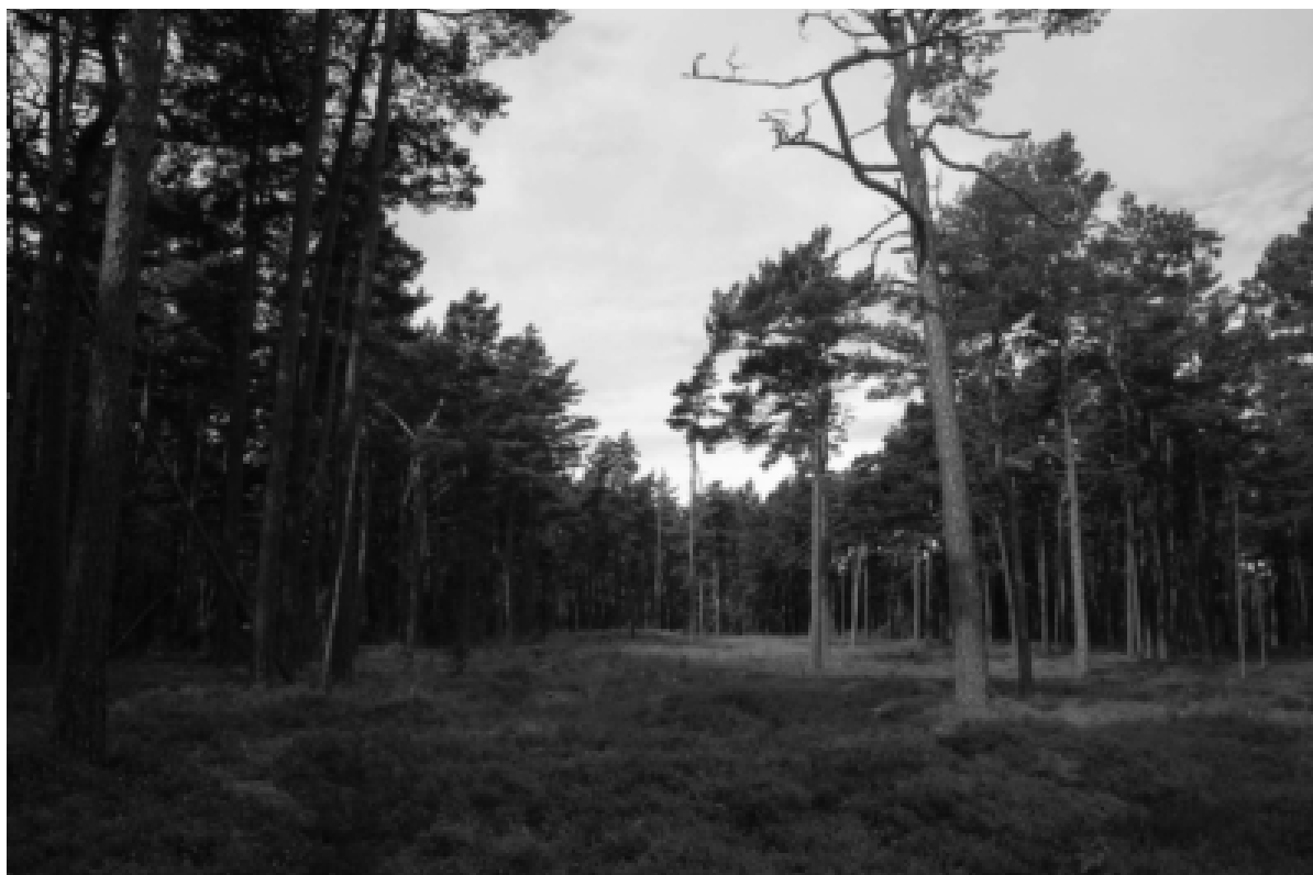
Sandhamn, eller ”Sonam” år 2015. Den vackert belägna platsen mellan Roslep och Derhamn, nordvästra Estland, användes av en kamratkrets för att bedriva friidrott under sent 1930-tal och tidigt 1940-tal. Efter evakueringen till Sverige har platsen i princip stått orörd, och några spår av de idrottsliga aktiviteterna finns inte kvar.