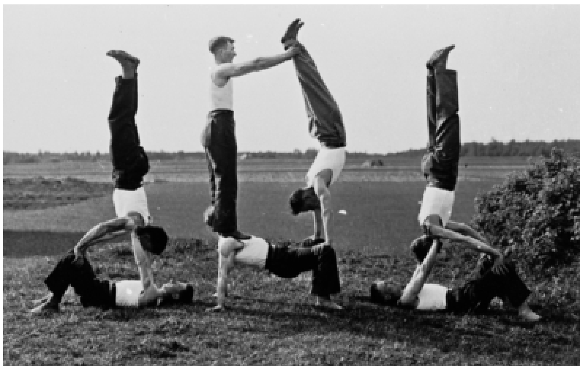
Uppvisning av pojkar från Nuckö.

Perioden av kulturell autonomi i Estland blev emellertid kortvarig. I depressionens kölvatten uppstod under tidigt 1930-tal en stark antidemokratisk rörelse som banade väg för en auktoritär och nationalistisk regering. Parlamentarismen avskaffades 1935