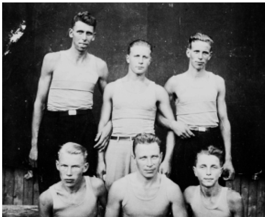
Volleybollag från Rickul.

vi lär oss på idrottsbanan bör vi senare var på sin plats använda som hävstång i vårt dagliga arbete. Gör vi det, kan vi också vara övertygade om, att det efter femtio år ej bör heta mer: 'de stackars fattiga estlandssvenskarna'.