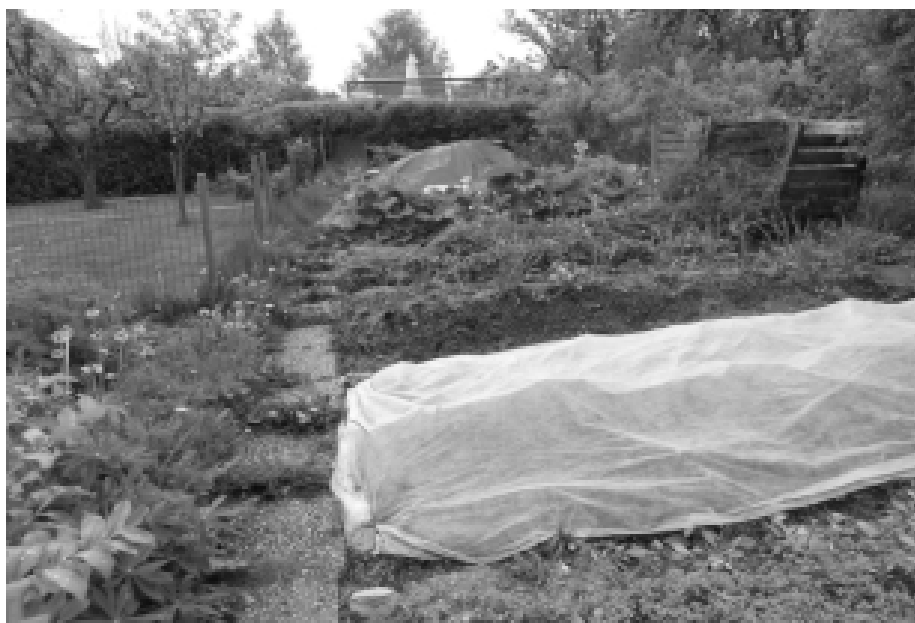
I detta grönsaksland tillåts en del växtlighet som annars ofta klassificeras som ogräs. Här skördas exempelvis lök, bönor, sallad och rabarber, men också nässlor och maskrosknoppar.

att olika uppfattningar och ideal står mot varandra inom samma familj och trädgård: