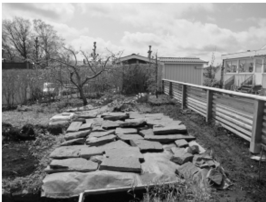
En strategi i kampen mot ogräset: Den tjocka presenningen under stenarna ligger på plats för att kväva kirska-len, och ”det är ju flera års projekt”, konstaterar trädgårdsinnehavaren (Intervju 10).

kamp mot naturen. Som vi sett kan ordet natur i en och samma trädgård exempelvis avse en särskild del av trädgården, ett estetiskt eller miljömässigt ideal, det kan vara ogräs och ohyra som hotar odlingarna men samtidigt också en föreställning om ett större sammanhang som trädgården ingår i. En av de många frågor som trädgårdsodlare ställs inför är hur mycket man ska styra och ordna i sina odlingar. Ibland är det självklart vilka växter som ska vårdas och vilka som ska rensas bort, men detta kan också vara en fråga där tycke och smak är olika.