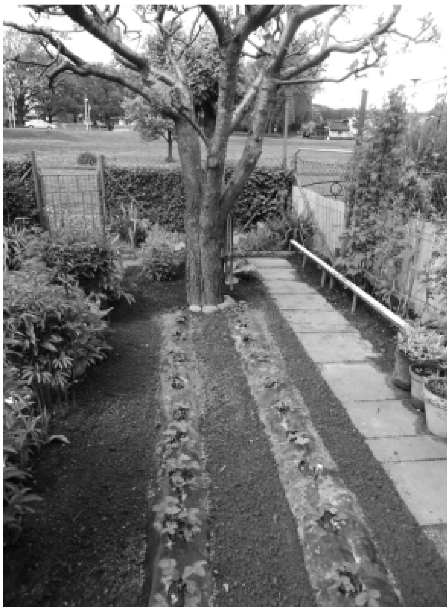
Växtlighet under kontroll. Perenner, jordgubbar och plommonträd omgivna av bar jord i en egnahemsträdgård från 1930-talet.

När vi flyttade till Silvergatan [1945] kom morbror Axel med en rabarberrot från sin koloniträdgård. När jag flyttade till Partille [1959], fick jag en rot av rabarbern av Mor. När jag flyttade till Gotland [1977], tog jag med mig rabarberrötterna till min nya trädgård. Det är det som blivit en 10 m lång häck, och som jag nu [2011] har en liten rot av i en kruka! (DAG F 1316).