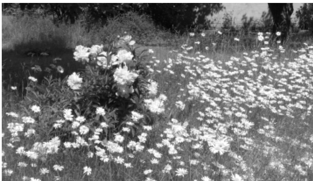
Är prästkragar som sprider sig ett ogräs eller ett välkommet tillskott? Svaret kan variera från en trädgårdsinnehavare till en annan. 3

Frågelistan som metod, med sin långa tradition inom den etnologiska forskningen (Nilsson et al. 2003, Hagström & Marander-Eklund 2009), uppmuntrar meddelarna att be-