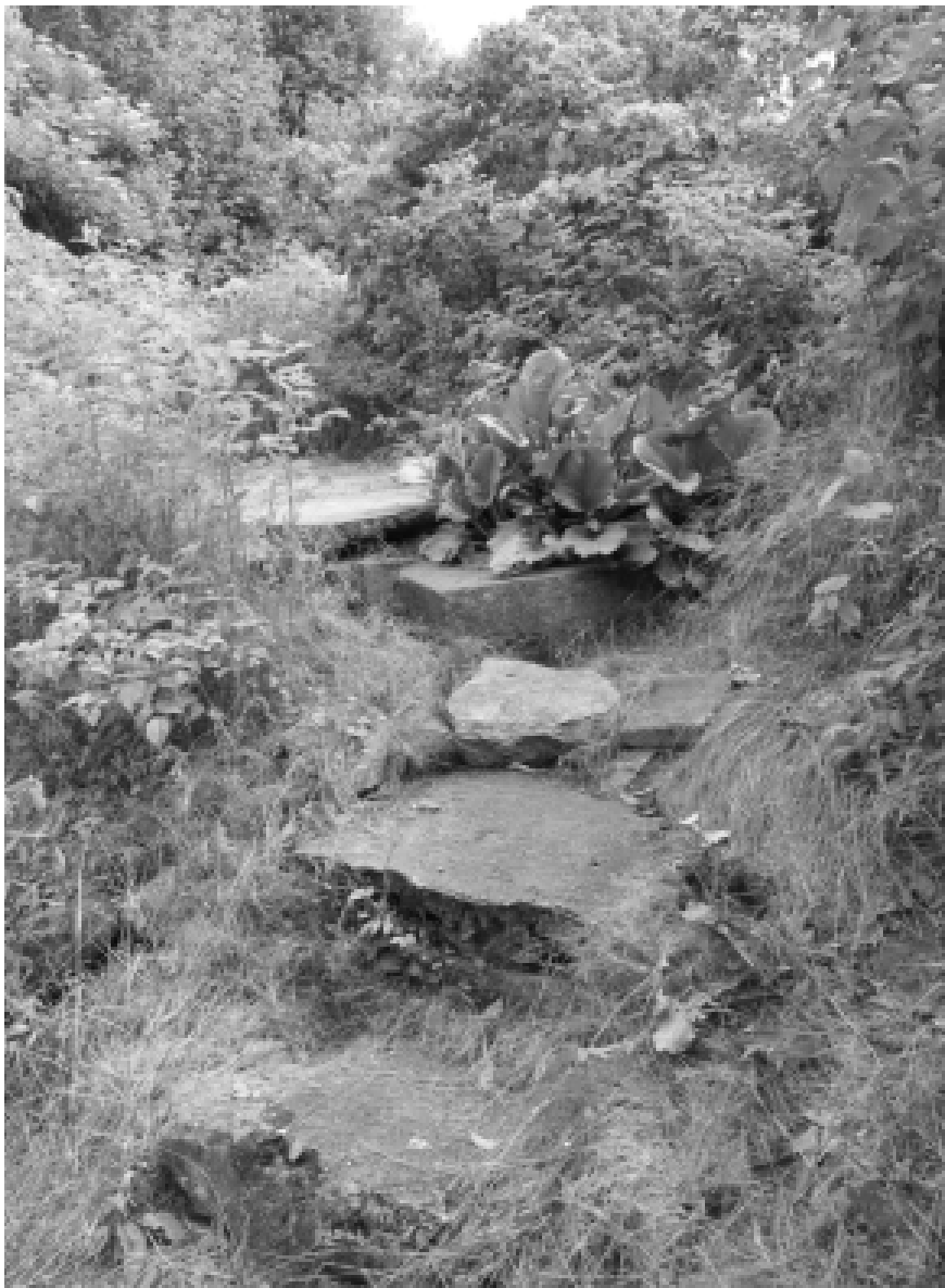
Gränserna mellan tamt och vilt, önskat och oönskat, ser olika ut i olika trädgårdar. Här välkomnas det vildvuxna, och flera arter skördas som medicinalväxter.

liga växter behöll vi en nästan enkel röd pion, en jätteplanta Helleborus niger , kaprifol i mängd, massor av påskliljor, pingstliljor och scilla, lila bollök, rosa höstflox och söder om skogspartiet, ett buskage med lila bondsyrener (DAG F 1530).