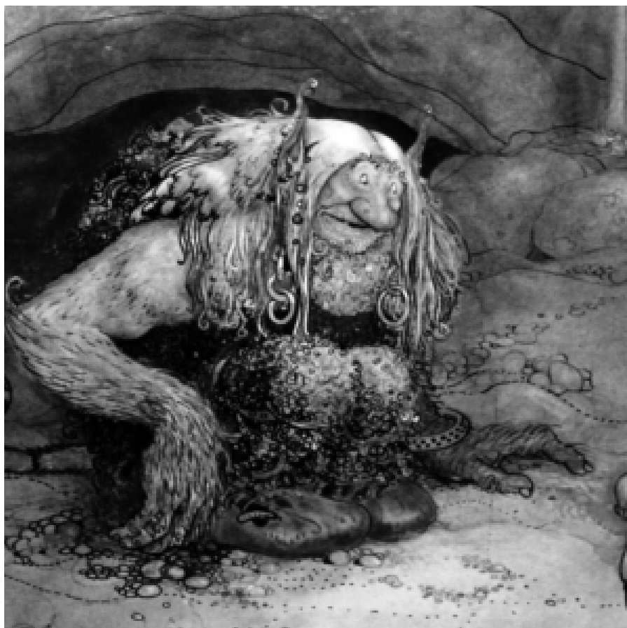
John Bauers illustrationer har präglat vår syn på hur troll ska se ut. Illustration till "Pojken som aldrig var rädd" av Alfred Smedberg i Bland tomtar och troll . 1912.