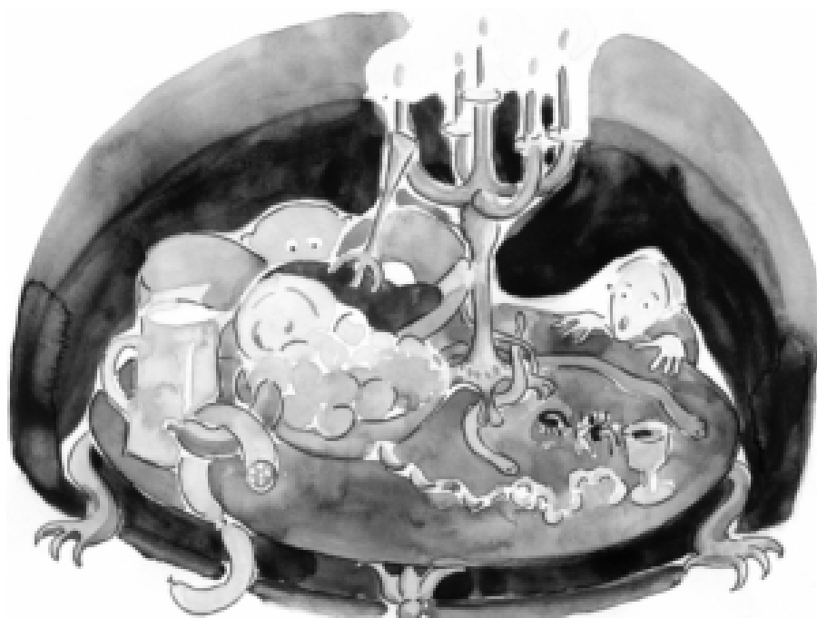
Trollen förmodades bete sig precis som människor, men det fanns alltid något avvikande som avslöjade dem, som när de bjöd på mat otjänlig som människoföda. Illustration: Karin Fabritius.

att socialbidragstagare har råd med så dyra barnvagnar (Suni 2014), eller när svenska uteliggares eventuella innehav av mobiltelefoner väcker anstöt (Nelson 2013). Också under humanitära kriser som de syriska båtflyktingarna diskuteras märkeskläder, mobiltelefoner och dyra armbandsur i både dagspress och på internetforum (se t.ex. Bruun 2015).