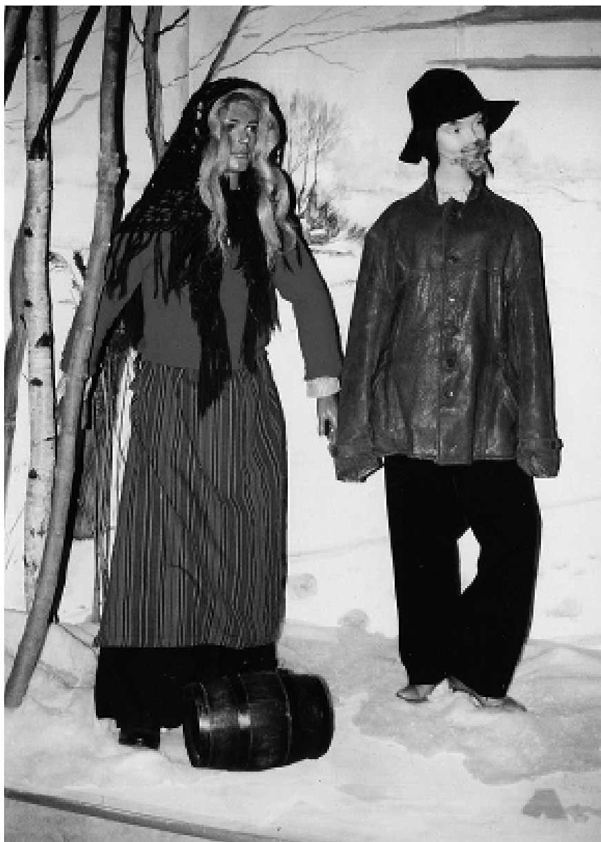
Julutställning 2014. Krone- torps mölla, Burlöv. Skylt- dockor som julaspöken.

Från Mjällby i Blekinge omtalar en sages- man, f. 1896: