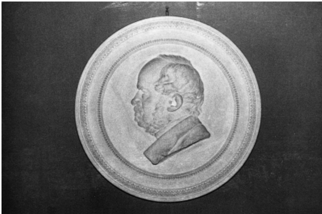
Carl Axel Mannerskantz. Bild från 1883.