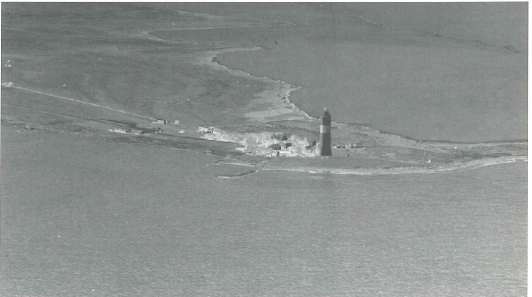
Fig. 1. The southernmost point of Öland, with the lighthouse, gardens and buildings surrounded by extensive meadowlands. The bird observatory buildings, extended since this picture was taken in the mid-1970's, lie to the left in the inhabited area.

This was the place where in the late 1800's the naturalist and taxidermist Gustaf Kolthoff had, with the help of his shotgun, pioneered wader migration research and, for example, been the first one to describe the sequential southward passage of different age-groups within the arctic waders (Kolthoff