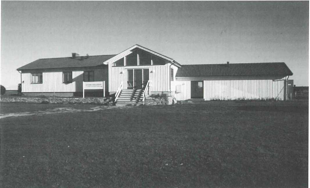
Fig 4. Fifty years later: Ottenby Bird Observatory after enlargement and renovation.

Femtio år senare: Ottenby fågelstation efter utbyggnad och renovering.