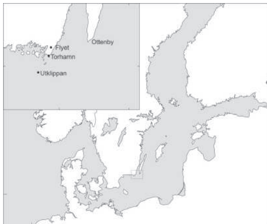
Figur 1. Karta som visar de tre fångstplatsernas läge. The location of the three trapping sites.

Kungsfåglarna fångades med traditionella slöjnet. Näten vittjades regelbundet med högst 30 minuters mellanrum. Fåglarna ringmärktes så snart det var praktiskt möjligt. Vid ringmärkningen bestämdes kön och mättes vinglängd. Fåglarna vägdes på en elektronisk våg. Vågarna var av samma