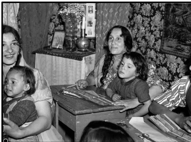
Familjen Taikon startade en skola i sitt tält år 1943. (Bild: Svenska Dagbladet, 5 juli 1943)