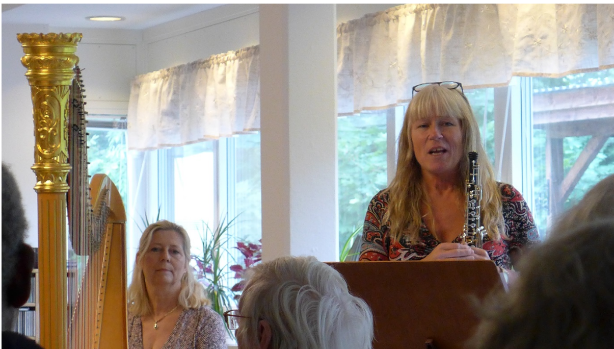
Bild 2. Prisma i konsert på Snäckberget