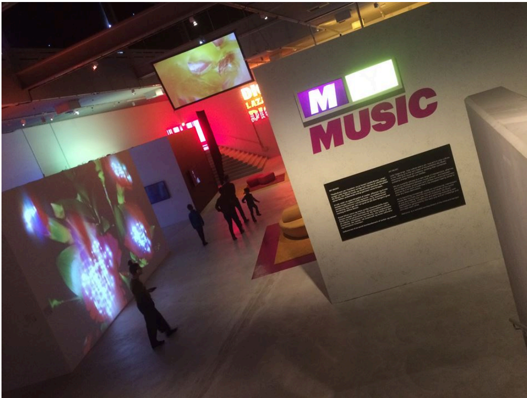
Bild från My Music, Arken, Köpenhamn, 2018.