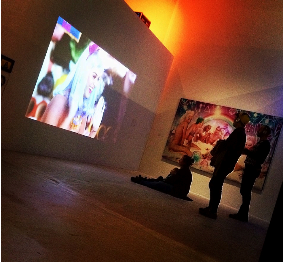
California Gurls . Bild från My Music, Arken, Köpenhamn, 2018.