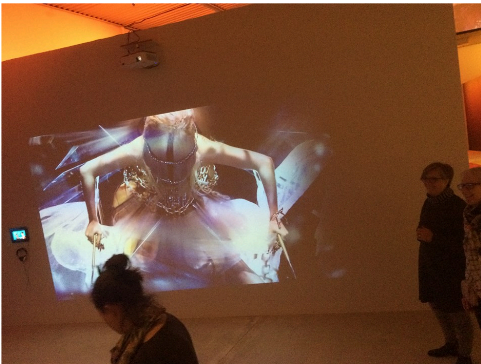
Born This Way . Bild från My Music, Arken, Köpenhamn, 2018.