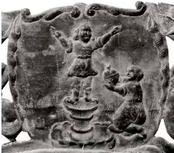
Fig. 6. Sophie Kaas' kisteplade fra Kundby Kirke, 1663, detalje.

Coffin plate from the coffin of Sophie Kaas, Kundby Church, Denmark, 1663.