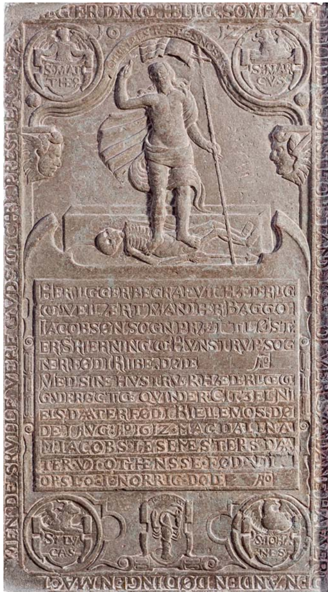
Fig. 3. Gravsten for pastor Bagge Jacobsen i Øster Skerninge, 1612.

Slab on the tomb of pastor Bagge Jacobsen in Øster Skerninge Church, 1612.