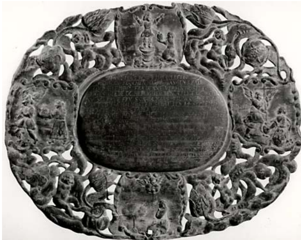
Fig. 5. Sophie Kaas' kisteplade fra Kundby Kirke, 1663.

Coffin plate from the coffin of Sophie Kaas, Kundby Church, Denmark, 1663.