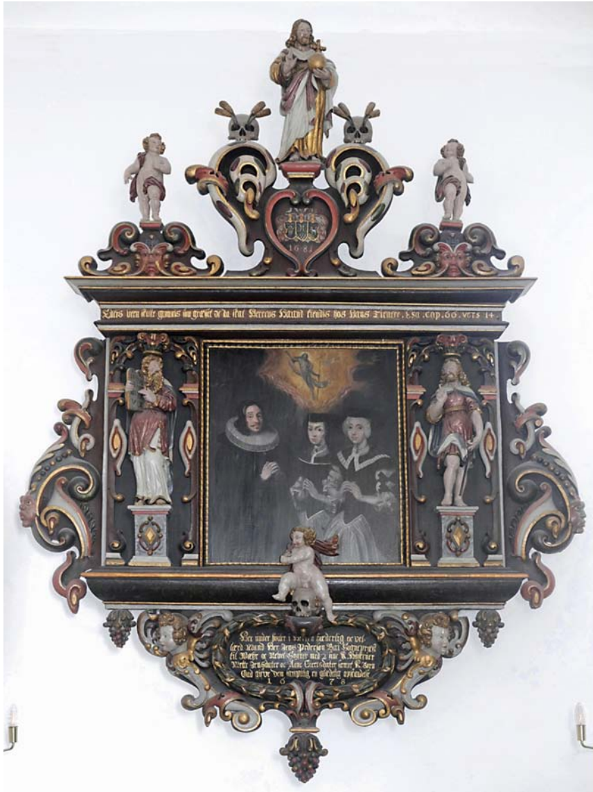
Fig. 1. Epitafium over præsten Jens Pedersen Bay i Vår Kirke, 1678–1681. Øverst ses kornaks skyde op fra kranier.

Epitaph of pastor Jens Pedersen Bay in Vår Church, Denmark, 1678–1681. At the top, ears of corn are sprouting up from the skulls.