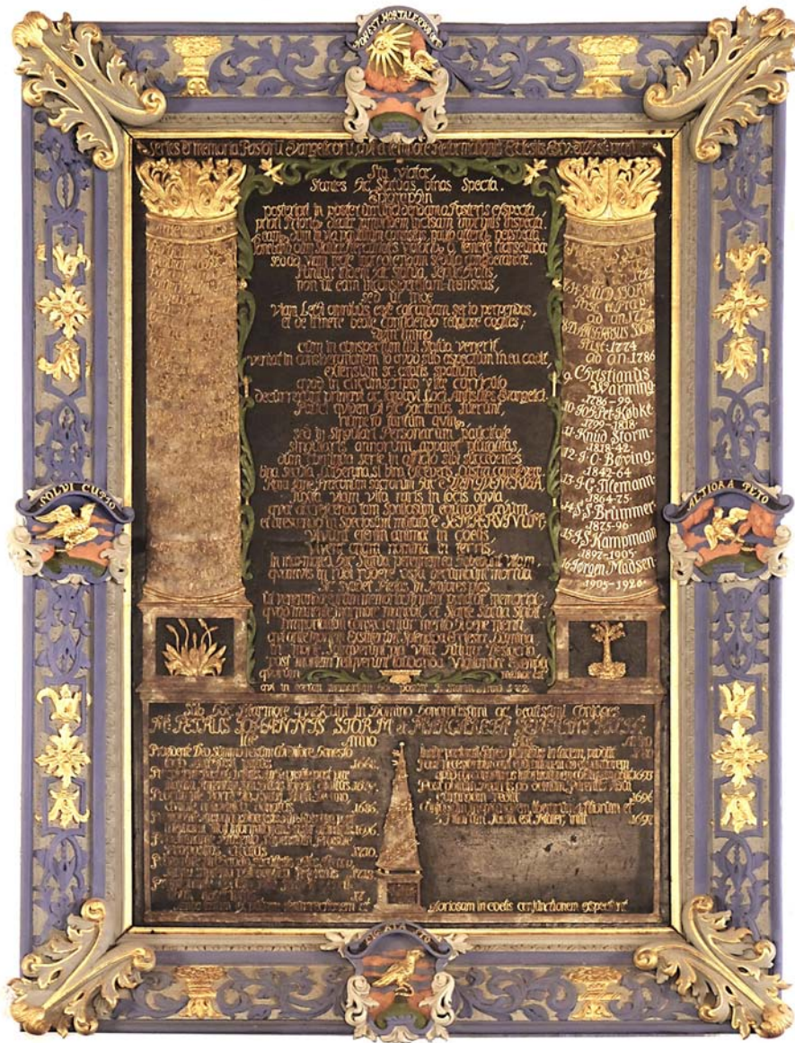
Fig. 10. Epitafium over pastor Peder Hansen Storm kombineret med series pastorum for Egtved Sogn, Egtved Kirke, 1720'erne, træ og sten.

Epitaph of pastor Peder Hansen Storm combined with a list of incumbents, Egtved Church, 1720s, wood and stone.