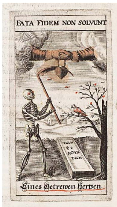
Fig. 9. Emblem, Echo Mutuae Voluntatis Sive Amicitia Dialogus, Lüneburg 1648.

Emblem, Echo Mutuae Voluntatis Sive Amicitia Dialogus, Lüneburg 1648.