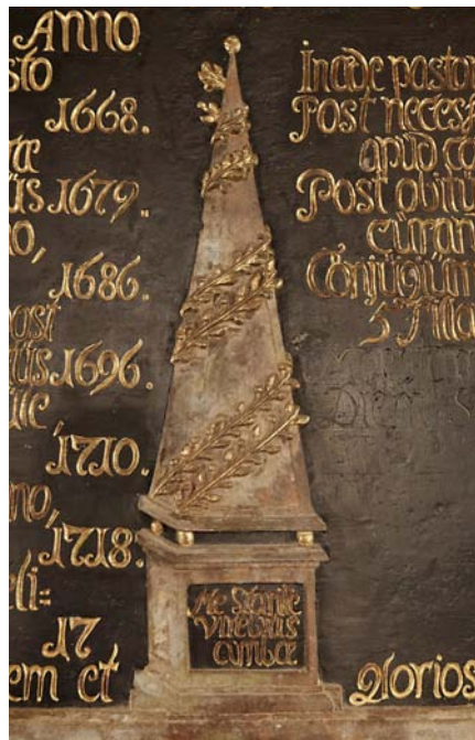
Fig. 14. Pyramide med efeu som motiv på pastor Storms tavle i Egtved Kirke, 1720'erne.

Pyramid with ivy as a motif on the tablet of pastor Storm in Egtved Church, 1720s.