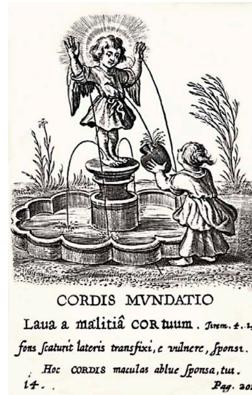
Fig. 7. Boëthius à Bolswert, Emblem "Cordis mundatio" fra Schola cordis , 1629.

af metal. Det har været svært at komme til klarhed over, hvor den eventuelt endnu befinder sig, da en del af kapellets kister blev begravet på kirkegården i 1960'erne. Vi må derfor henholde os til de fotos, der er tilgængelige på Nationalmuseet i København, og de afslører, at kistepladen bestod af et tværovalt indskriftsfelt omgivet af blomsterornamentik og fire emblemer, hvis motiver Danmarks Kirker ikke har fundet forlæg for (fig. 5–6). 12 De stammer imidlertid fra Benedict van Haefkens udbredte andagts- og emblembog Schola Cordis , der som sagt udkom første gang på latin i Antwerpen i 1629. Bogen var illustreret af Boëthius à Bolswert. Den blev udgivet på tysk i Augsburg i 1664 under titlen Hertzen Schuel . 13 I bogens emblemer er der to gennemgående figurer, der deltager i hjertets dannelse. Den ene med vinger og nimbus er Amor divinus . Den anden klædt i et langt gevandt og med hårknode, er den kvindelige anima, altså et billede på den menneskelige sjæl. Der ligger altså en bryllups-