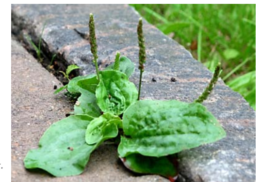
Fig. 12. Vejbred i forfatterens have, 2025.

Gilded carving of a plantain on the tablet of pastor Storm in Egtved Church.