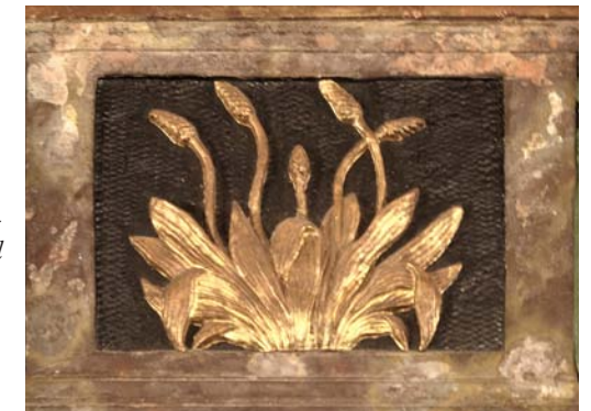
Fig. 11. Forgyldt relief af planten vejbred på pastor Storms tavle i Egtved Kirke.

Plantemetamorforikken er åbenlys. Den simple og hårdføre vejbred, der mødes langs alfarvej og sådan set markerer vejens forløb, er billede på præsterne. Den er en retningsmarkør for andre. Ved at have slået rod gennem mange år, bliver den i tørret form til en evighedsblomst. Her svigter konsekvensen noget, for det er jo ikke som en presset og tørret blomst i det kirkelige herbarium, vi ser den, men som den udødelige, ranke palme, der traditionelt er udtryk for konstans og dyd.