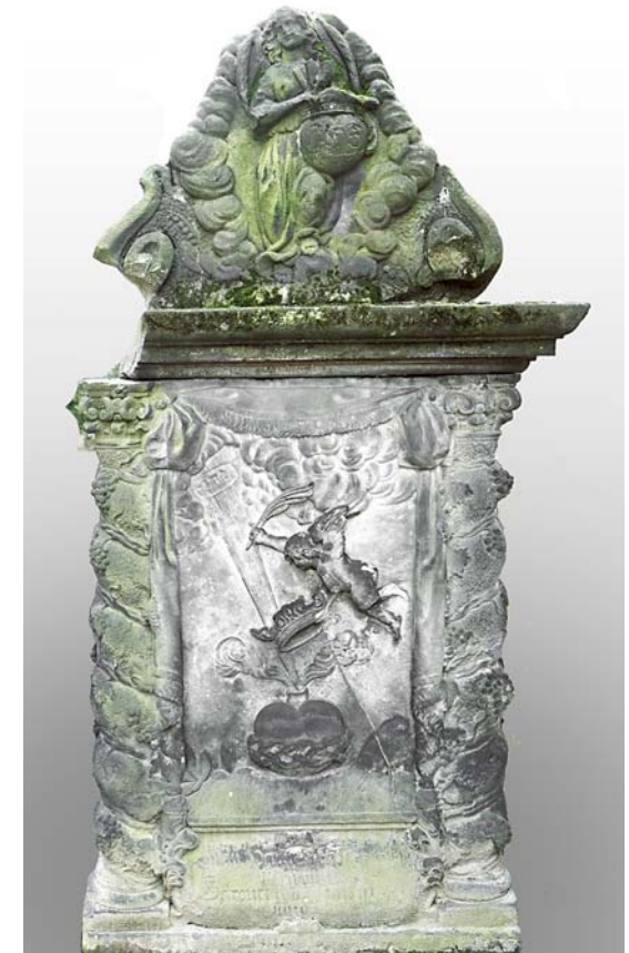
Fig. 4. Gravsten, udateret, placeret uden for museet i Zittau, Oberlausitz, Sachsen, Tyskland.

Emblemer inden for denne genre eller kreds fra Nederlandene synes at have været mere populære – eller i hvert fald hyppigere anvendt som forlæg for udmalinger – i Slesvig, Norge og Sverige end i Danmark. 11 Ikke desto mindre er det lykkedes mig at finde et fint eksempel på brug af dem i Kundby Kirke på Sjælland (Tuse Herred, Holbæk Amt). Det er en meget stor og højt beliggende kirke, hvis ene nordkapel i 1600-tallet blev inddraget som gravkapel for medlemmer af den lokale adel og kirkens ejere.