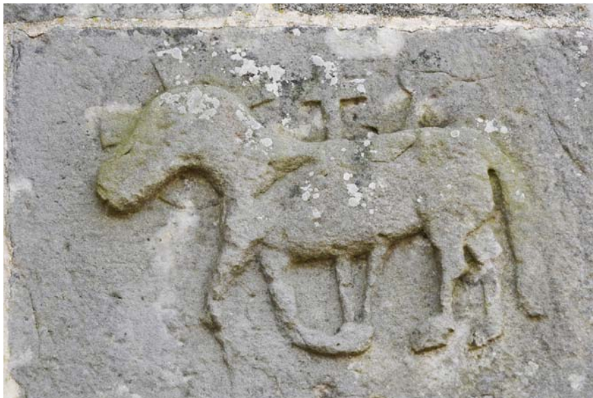
Fig. 20. Mariakyrkan i Vä. Relief med Agnus Dei på korets nordöstra hörn (se fig. 3).

Church of St Mary, Vä, Scania. Relief with Agnus Dei on the northeast corner of the chancel.