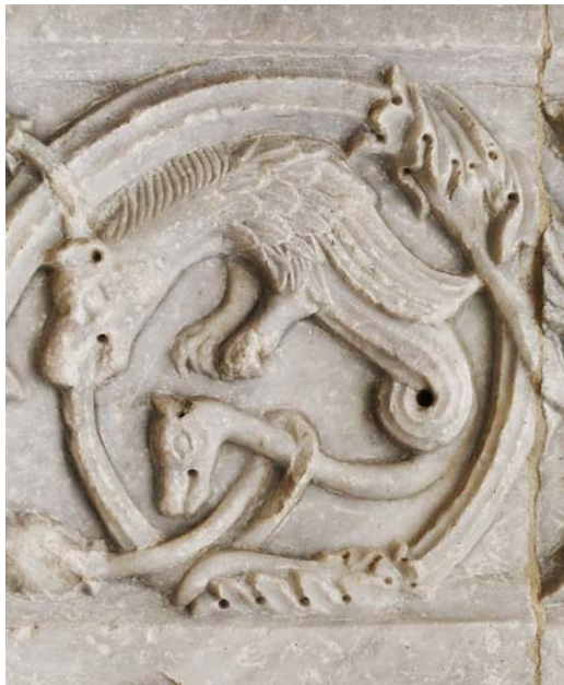
Fig. 10. Amphisbaena på fasaden till San Rufino, Assisi, tidigt 1100-tal. Amphisbaena on the facade of San Rufino, Assisi, early 12th century.

Eller amphivena , amphisbaina , amphisbene , amphisboena , amphisbona , amphista , amfivena , amphivena , av grekiskans amphis (båda hållen, bådadera) och bainein (att gå) är en grekisk mytologisk varelse som nämns av bl.a. Aiskylos, Plinius d.ä. och Isidorus. Plinius konstaterar kort att ”The Amphisbaena has a twin head, that is one at its tail-end as well, as though it were not enough for poison to be poured out of one mouth” ( Naturalis Historiae , bok 8:85), och Isidorus kompletterar med att den har ögon som skiner som lampor och att den är den enda orm som inte skyr kyla ( Etymologiae , bok 12, 4:20). Den har alltså två huvuden, ett på det vanliga stället och ett i andra ändan, vanligen på något slags svans/stjärt. De tidiga källorna omtalar den som en giftig orm som livnär sig på kadaver. Under medeltiden förses den med ett par ben, ibland med två, som är försedda med tassar eller fågelklor. Ibland har den vingar, ibland inte. Huvudena är likadana eller olika och kan likna ormars, drakars eller olika