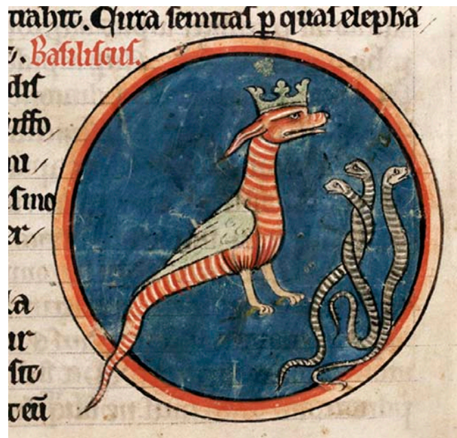
Fig. 4. Basiliken, ormarnas konung. Bestiarium , England, 1200-tal. British Library, Harley MS 4751, f. 59r.

The basilisk, king of the snakes, in an English Bestiary from the 13th century.