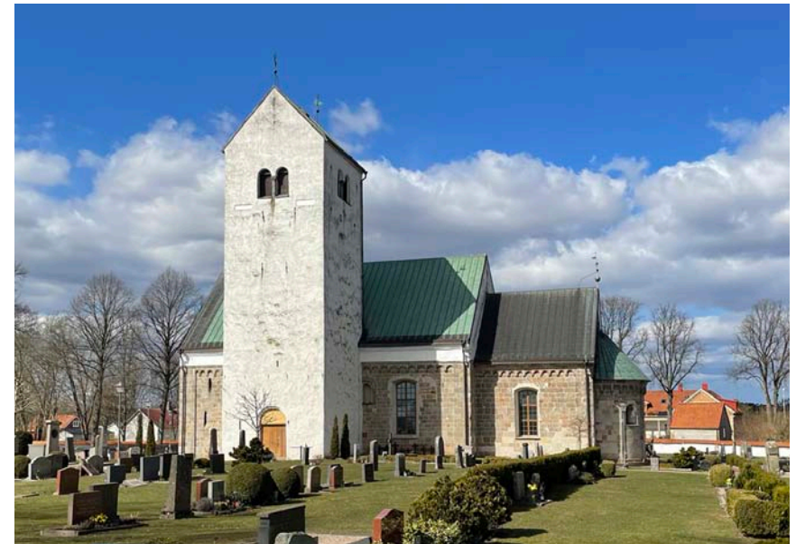
Fig. 2. Mariakyrkan i Vä från sydöst. Church of St Mary, Vä, Scania, from southeast.

Isidorus har på 600-talet ( Etymologiae , bok 12, 4:6–9) inget att tillägga beträffande basiliskens utseende och på 1200-talet förklarar Bartholomeus Anglicus ( De proprietatibus rerum , bok 189) att namnet kommer sig av att den är ormarnas kung (grek. basilevs ). Varken dessa två eller någon av de andra texterna