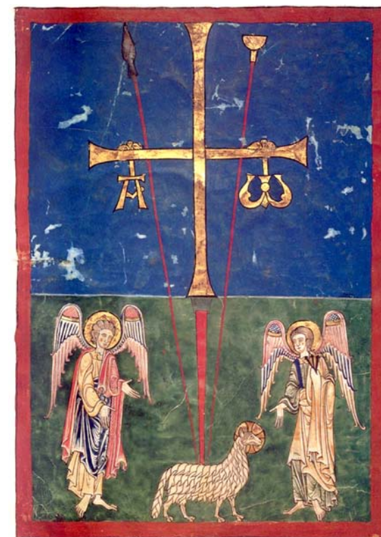
Fig. 21. Frontespisen till Cardeña Beatus-manuskriptet, Spanien, ca 1175–1180. Nu i Metropolitan Museum of Art, New York. MS 232 f. 1v. Efter Wixom & Lawson 2002, 16.

Går man till samtida eller tidigare framställningar av korsfästelsen står det genast klart att man ignorerar isopen och avbildar den med vinäger indränkta svampen som uppträdd på spetsen av en lans. Svampen betraktas som ett av passionsredskapen och delar av den är vördade relikier i ett antal kyrkor i Italien, Frankrike och Tyskland. Att lammet förekommer tillsammans med kors och två lansar, av vilka den ena är svampförsedd, förekommer ytterst sällan. I det äldre materialet har jag bara hittat det i ett par Beatus -illuminationer, men inte i något fall bär lammet på lansarna (fig. 21). 29 Efterhand blir det dock vanligare att kombinera lammet med pinoredskapen och i exempelvis Jan van Eycks be-