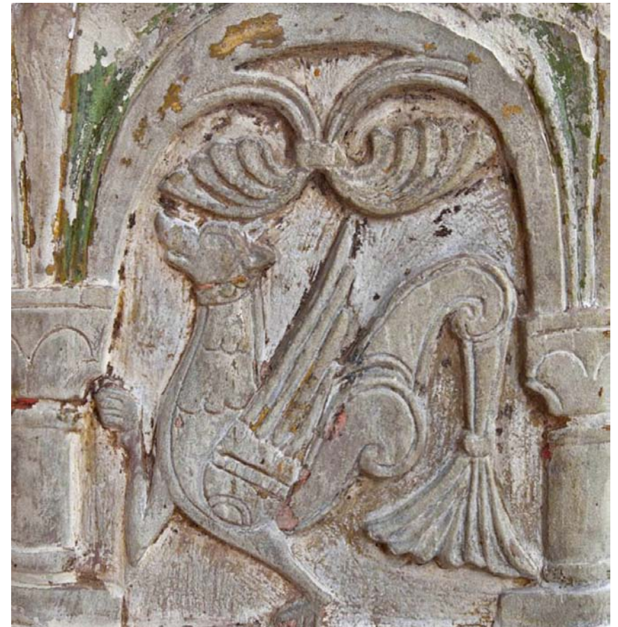
Fig. 19. Senmurv på dopfonten i Atlingbo, Gotland, tillskriven anonymmästaren Byzantios och daterad till ca 1150. Foto Lars Berggren 2016.

Simurgh on the baptismal font, Atlingbo, Gotland, attributed to "Byzantios", c. 1150.