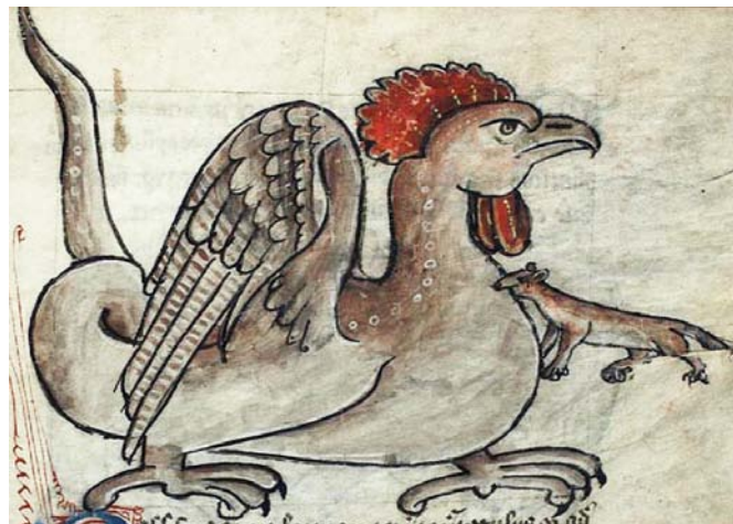
Fig 5. Basilisk med tuppkam och en vessla som biter den i halsen. The Bestiary of Anne Walshe , England, ca 1400. Köpenhamn, Det Kongelige Bibliotek , Gl. kgl. S. 1633 4 o , f. 51r.

The basilisk, king of the snakes, in an English Bestiary from the 13th century.