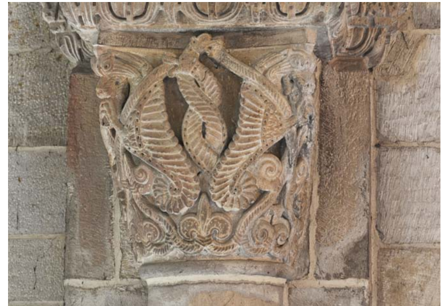
Fig. 11. Amphisbaenor i Lunds domkyrka, ca 1100, på kapitälet till den östligaste av södra sidoskeppets kolonner. 2014.

Lund Cathedral, Scania, Sweden. Amphisbaenae on the capital of the easternmost column in the south aisle, c. 1100.