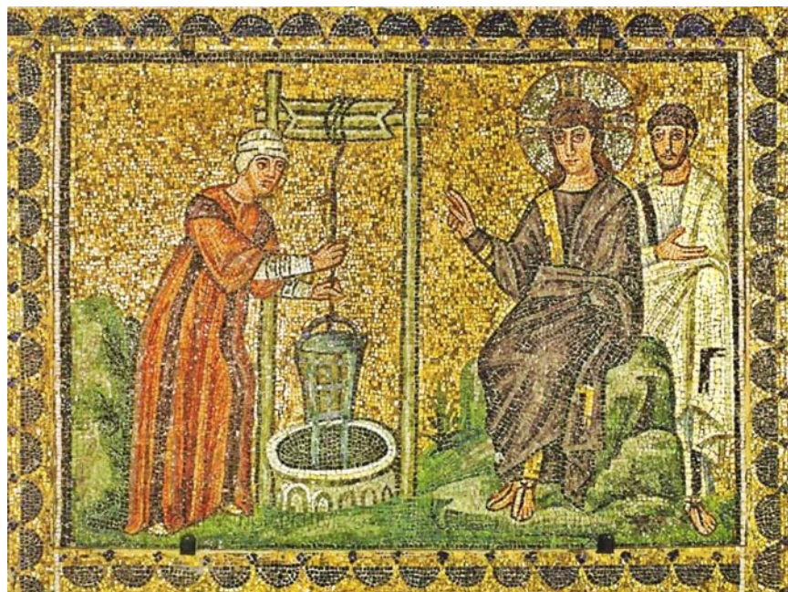
Fig. 7. Sant'Apollinare Nuovo, Ravenna, mosaik från tidigt 500-tal. Sant'Apollinare Nuovo, Ravenna, mosaic from early 6th century.

proviantera. Där träffar han en samarisk kvinna och ber henne om vatten. Hon undrar förvånat hur det kan komma sig att en jude tilltalar en samarier, ett av judarna avskytt och föraktat folk. Då svarar Jesus att om hon hade vetat vem han var hade hon bett honom om levande vatten, vatten som gör att man aldrig mera törstar och som ger evigt liv. För att göra en ganska lång historia kort så inser kvinnan att den hon talar med är Messias, kommer till tro och går tillbaka in i staden för att sprida budskapet. Under tiden har lärjungarna kommit tillbaka med matvaror, och småningom kommer också stadsborna ut för att beskåda den märklige mannen. Även de omvänds och när Jesus två dagar senare lämnar Sykar är samarierna övertygade om att han är världens frälsare.