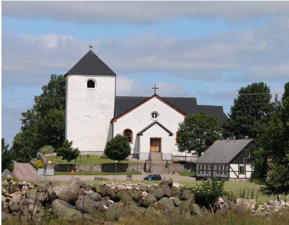
Fig. 1. Östra Sallerups kyrka från söder. Östra Sallerup Church, Scania, seen from the south.

De skånska kyrkornas etablering och dateringen av deras kalkmålningar har varit ett kärt ämne för konsthistoriker och arkeologer alltsedan 1800-talet. En väsentlig men ofta förbisesedd faktor är att stora delar av landskapet inte koloniserades förrän under 1100-talets andra hälft och 1200-talets början. I artikeln behandlas Östra Sallerups kyrka i Frosta härad – häradet ”mellan skogen och plogen” – i Ringsjöbygden, mitt i Skåne. I det följande studeras de geografiska, demografiska och politiska förhållanden som låg bakom kyrkans etablering, måleriets motiv och dess härkomst. 1 Speciell uppmärksamhet ägnas sedan målningen med motivet ”Kristus och den samariska kvinnan vid Sykars brunn” och dess möjliga förebilder i medelhavsområdet, särskilt då mosaiken med samma motiv i Monrealekatedralen på Sicilien. I litteraturen är beskrivningar av målningarna i Östra Sallerup för övrigt sparsamt förekommande och nämns då oftast på få rader – sannolikt på grund av deras fragmentariska tillstånd. 2