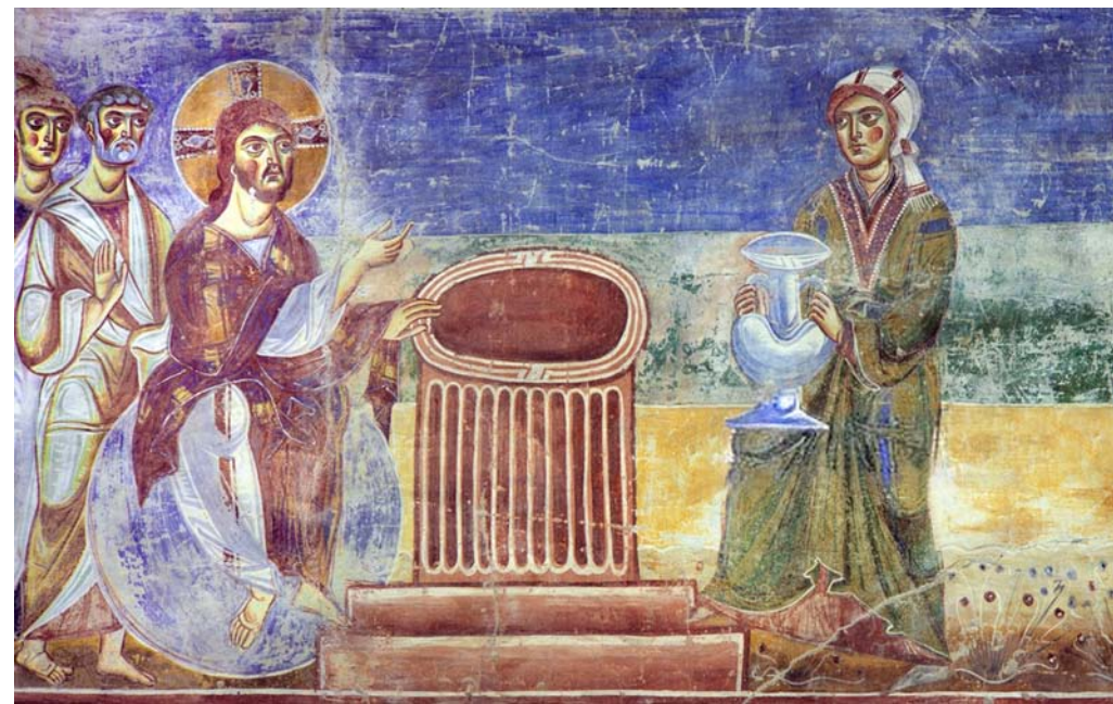
Fig. 8. Sant'Angelo in Formis, Capua, muralmålning från sent 1000-tal. Sant'Angelo in Formis, Capua, wall painting from late 11th century.

Berättelsen om vad som hände vid Sykars brunn är viktig eftersom den visar att kristendomen är universell och öppen för alla, oavsett ursprung och social status, även för syndare som den samariska kvinnan (som enligt bibeltexten haft fem män). Hon fortsatte enligt legenden att sprida det evangeliska budska-