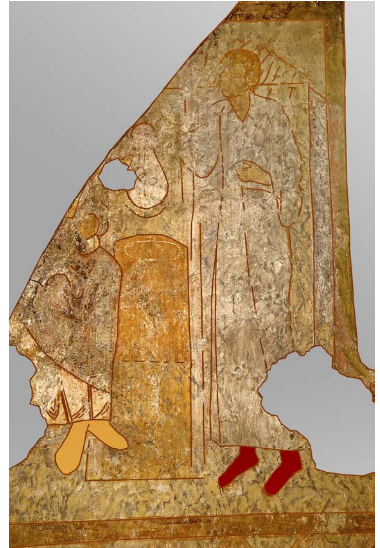
Fig. 11. Kalkmålningens bevarade detaljer förstärkta genom analys av fotografier tagna med olika våglängder av ljus.

Östra Sallerup Church. The image of Jesus Christ and the Samaritan woman, on the northern choir wall. The painting is very worn and unclear. The figures are standing with their feet a little over two metres above the floor.