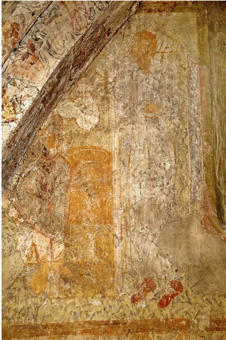
Fig. 10. Östra Sallerup. Bilden av Jesus och den samariska kvinnan på den norra korväggen. Målningen är mycket sliten och diffus. Figurerna står med fötterna drygt två meter över golvet. Foto Ulf Sivbed 2020.

Östra Sallerup Church. The image of Jesus Christ and the Samaritan woman, on the northern choir wall. The painting is very worn and unclear. The figures are standing with their feet a little over two metres above the floor.