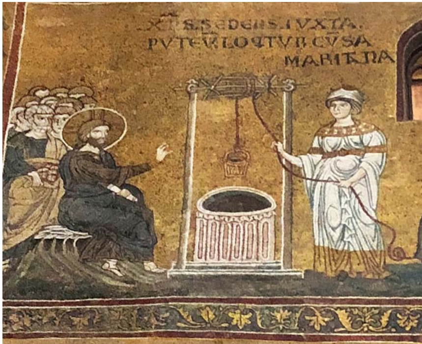
Fig. 9. Kristus och den samariska kvinnan vid Sykars brunn. Mosaik i domen i Monreale (Palermo, Sicilien). Ca 1180–1190. Texten lyder i Andreas Dahlgrens översättning: Kristus sittande intill brunnen, talar med den samariska kvinnan.

Christ and the Samaritan woman at Sychar's well. Mosaic in the Cathedral of Monreale, (Palermo, Sicily). Ca 1180–1190. The Latin inscription in translation: Christ is sitting at the well, speaking to the Samaritan woman.