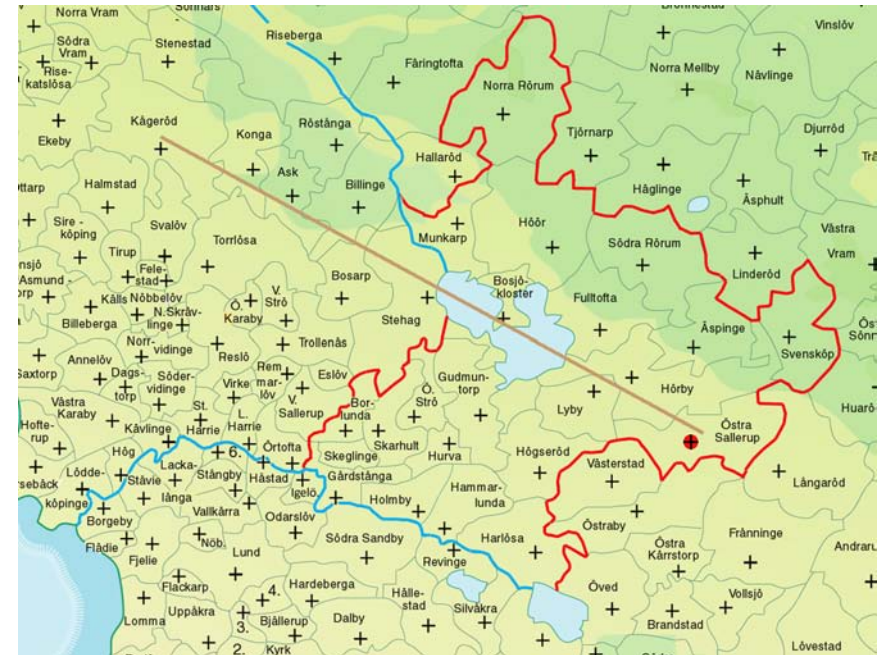
Fig. 3. Frosta härad med Thornqvistzonen markerad med den bruna linjen. Den kargare, norra delen av häradet verkar ha röjts och koloniserats under 1100-talet. Underlag: Kenneth Berhman med komplettering av Anders Ödman.

Då Lunds domkyrka stod klar 1145 påbörjades byggandet av Herrevad kloster och möjligen Bosjö kloster. Därutöver uppfördes under det kommande halvsekle cirka 300 stenkyrkor. Detta främst för att det nu fanns kultiska be-