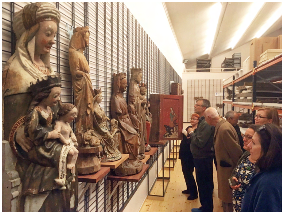
Symposiedeltagarna besökte NTNU Vitenskapsmuseet, där det gavs utmärkt tillfälle för närstudium av bl.a. medeltida skulpturer i kyrkosamlingens magasin. Foton av Lars Berggren, s. 58–64.

Stiklestad. Symposiets tema var Bilder i Norden ca 900-1700 . Med detta breda tematiska anslag var det arrangörernas mål att deltagarna skulle fokusera på de nordiska ländernas gemensamma historia, på den nordiska gemenskapen, och fånga upp frågeställningar som: Vad är det "nordiska" i vår kultur? Hur synliggörs den gemensamma nordiska historien i dess olika skeeden i konst och arkitektur? Finns det dekorativa och ikonografiska fenomen som är särpräglade för våra nordiska regioner, eller finns det exempel på ett förmodernt bild-