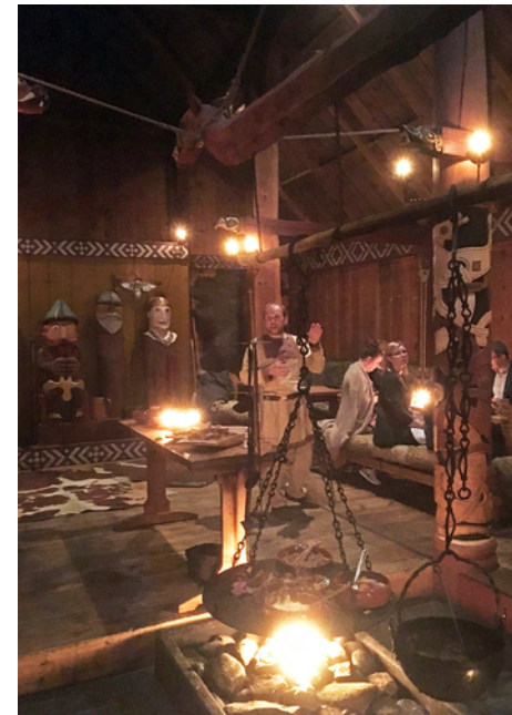
Interiör från Stiklestads gildehall, då långhuset och maten presenteras för symposiedeltagarna.