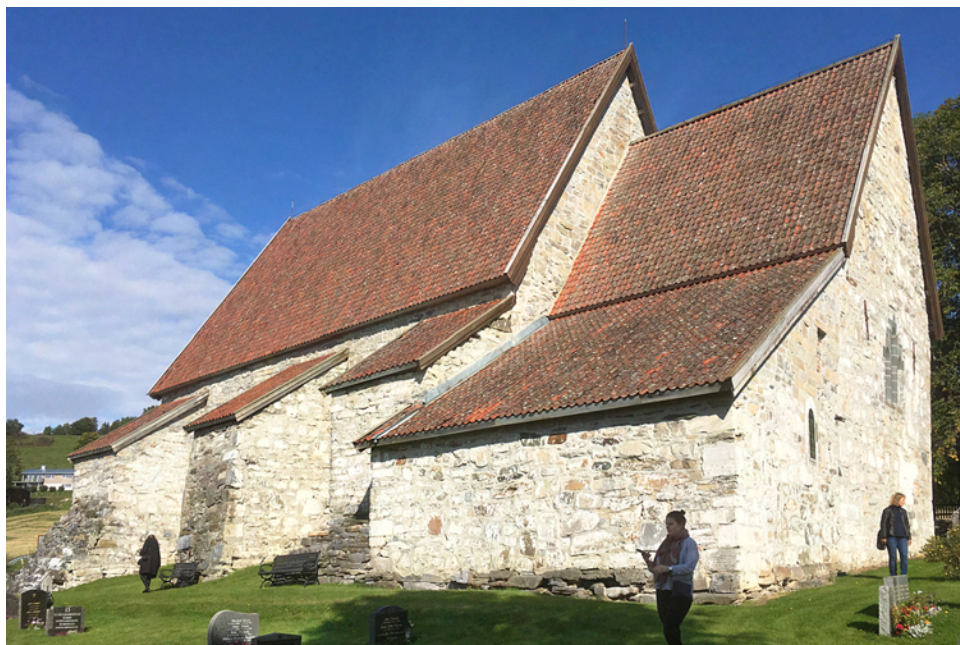
Sakshaug gamla kyrka i Inderøy, från 1100-talet, restaurerad 1926–1958.