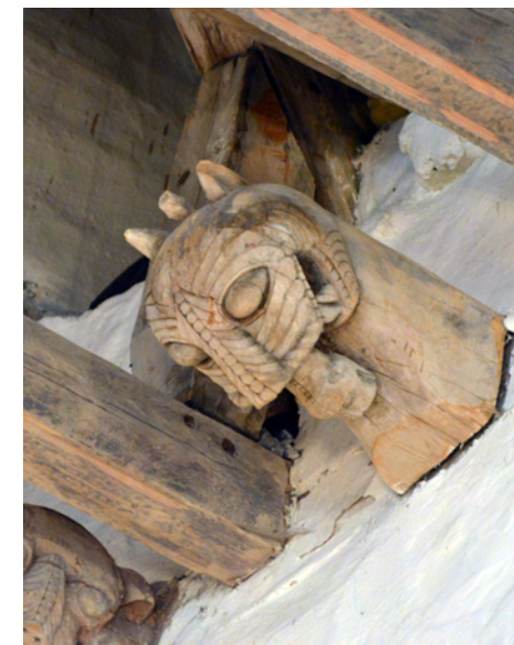
Mære kyrka (1150–1200), lejonhuvud i trä, avslutning av stickbjälke.