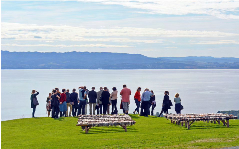
Symposiedeltagarna beundrar utsikten över Trondheimfjordens inre del från Øyna Parken, Inderøy.