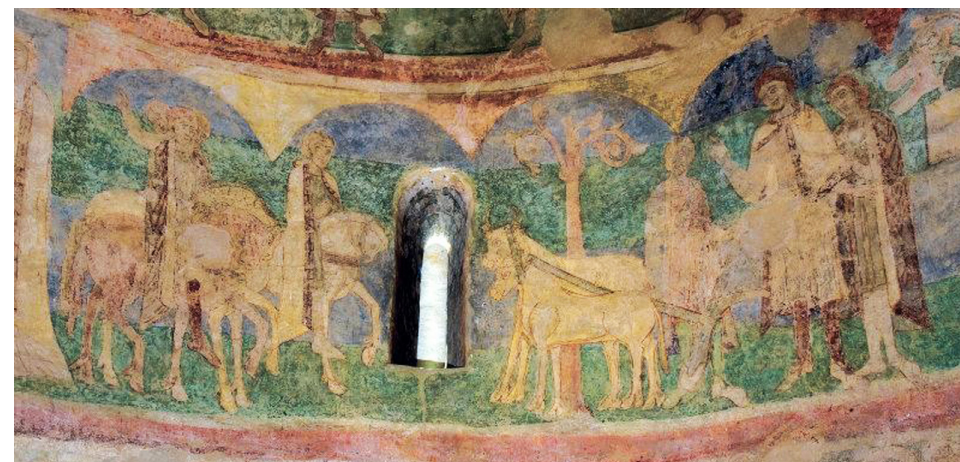
Fig 7. Fresken med motivet om den mytiske hertug, plovmanden Přemysl, der udvælges til bryllup med den fornemme og synske Libuse. Den følger Cosmas af Prags beretning. Cosmas døde 1125.

The upper frieze of the dome with four seraphim and four evangelists. Underneath them parts of the frieze are visible, with the dukes of the house of Přemysl. They carry lances with flags, and some are holding shields with heraldic symbols, and nine of them are wearing cloaks.