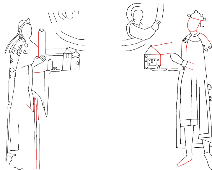
Fig. 3. Kalker af de kongelige stiftere i Vä Kirke, Skåne. Stifterne på korets østvæg stillet over for hinanden. Tegnet af Asmus Gemmer Haastrup.

I apsis troner Kristus på regnbuen i en mandorla, som forneden løftes af to engle. På siderne står Jomfru Maria og Johannes Døberen, som i en Deesis. 10 Langs apsiskanten er en bort med 12 halvfigursengle. Under mandorlaen var oprindeligt en lavfrise med de 12 apostle i arkader. I de skandinaviske apsisudsmykninger findes Majestas Domini omgivet af de fire