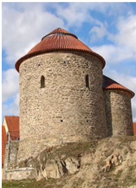
Fig. 5. Znojmo, Tjekkiet, eksteriør af rotunden, apsis, kuplen og resten af vesttårnet.

Znojmo, the Czech Republic, the exterior of the Rotunda, showing the apse, the dome and the remains of the western tower.