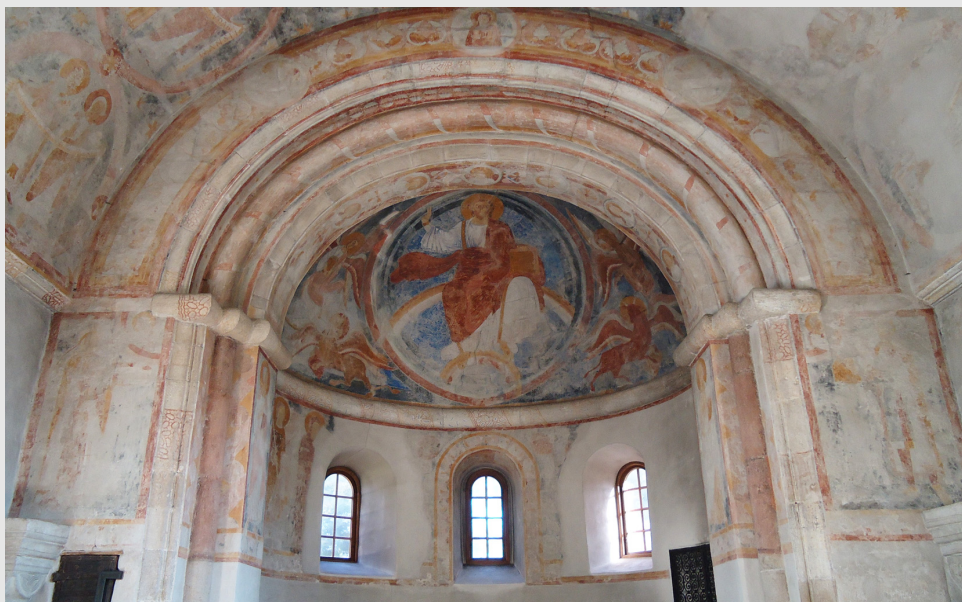
Fig. 1. Apsidsumyknningen i Vä kirke flankeret af stifterfigurerne, Skåne, Sverige, 1121.

Vä stifterne: Konge og Dronning, unavgivne, indridset runeindskrift, alterrelikvier med pergamentlap, 1121 Kong Niels (1104 – 1134) og Margrethe Fredkulla. Stifterikonografi: Stående, store som de hellige figurer, gavegivende, Gud i halvfigur i cirkel modtager gaverne. Dronningen i nord holder kirke-modellen, kongen i syd holder et stort relikvieskrin (fig. 3). Stifterbeklædning: kongen med kongekrone med kugler og øreflig, ringbrynje med hvid underkjortel. Kappen ankellang skindforet, også i folden fortil. Stoffet er byzantinsk silke med store røde cirkler, røde strømper og gule sko. Dronningen med hvidt koneklæde med gyldent bånd, en purpurfarvet nakkesnor og byzantinsk øring. Fodlang kjole af mønstret silke, lange hængende ærmer over stramt underærme. Kappen ankellang med udstående nakkefold og skindfor også i forkanten. Silken er byzantinsk med store cirkler - svarende til kongens kappe og ærkeenglens stof i apsis.