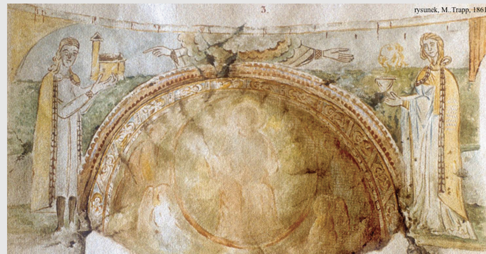
Fig. 2. Apsidsumyknningen flankeret af stifterfigurerne i S. Kathrina Rotunden, Znojmo, Tjekkiet, 1134. Akvarel fra afdekningen af freskerne 1861 af M. Trapp. Efter Dvořáková 2010.

The Vä Patrons: King and Queen, unnamed, rune engraving on the wall, altar relics with a piece of parchment reading 1121. King Niels (1104-1134) and Margrethe Fredkulla. Patron iconography: Standing, as large as the holy figures, bearing gifts, God in half-length in a circle receiving the gifts. The Queen to the north is holding the model of the church, The King to the south is holding a large golden reliquary (fig. 3). Patron garments: The King with a crown with ovals on top and earflaps, chainmail armour with a white robe underneath. The cloak running to the ankles is fur lined, including the hem to the front. The tissue is Byzantine silk with large red circles, he is wearing red socks and yellow shoes. The Queen with a white veil and band around the head, a scarlet band is running down from the neck and she is wearing a byzantine earring. Her dress running to her feet, from patterned silk, long hanging sleeves over tight undersleeves. The cloak running to the ankles and with the collar turned out, fur lined, including the hem to the front. The silk is Byzantine with large circles, corresponding to the King's cloak and the archangel's garments in the apse.