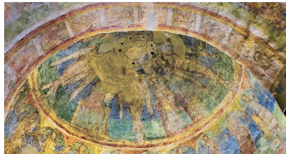
Fig 6. Kuplens øvre frise med ialt fire serafer og fire skrivende evangelister. Herunder ses dele af frisen med Přemysl slægtens hertuger. De holder lanser med faner og nogle har skjolde med heraldiske symboler.

Hertugslægtens oprindelse er – direkte gengivet efter Cosmas' fortælling – malet i Rotunden i 1134, små 20 år senere, i sce-