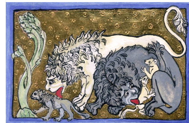
Bestiarium i British Library (Royal MS 12 C. xix), 1200-talet början.

seum i Rom. De sista europeiska lejonerna anses nu ha dött ut omkring Kristi födelse, men samma slags lejon fanns kvar i Mellanöstern och Nordafrika en bra bit in på 1900-talet. Även i Asien utrotades de nästan helt under 1800- och 1900-talen, och idag finns det bara en liten spillra av denna lejonstam kvar i en nationalpark i nordvästra Indien.