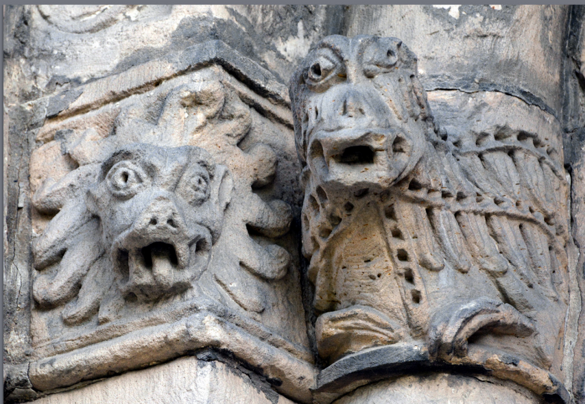
Två lejon på nordportalens östra kapitälband

Lejon har sedan urminnes tider spelat en stor roll inom både religiös och profan symbolik. De nämns också på mer än 100 ställen i Bibeln. Mest berömda är historierna om Daniel i lejongropen (Daniel 6) och Simsons strid med lejonet (Domarboken 14:6). De stora katterna förekommer dessutom i en rad helgonlegender, och då i synnerligen skiftande roller. Lejonet är starkt och farligt men enligt urgamla traditioner också modigt och rättvist, och därför konungen i djurens rike. Som alla monarker kan lejon vara både onda och goda.