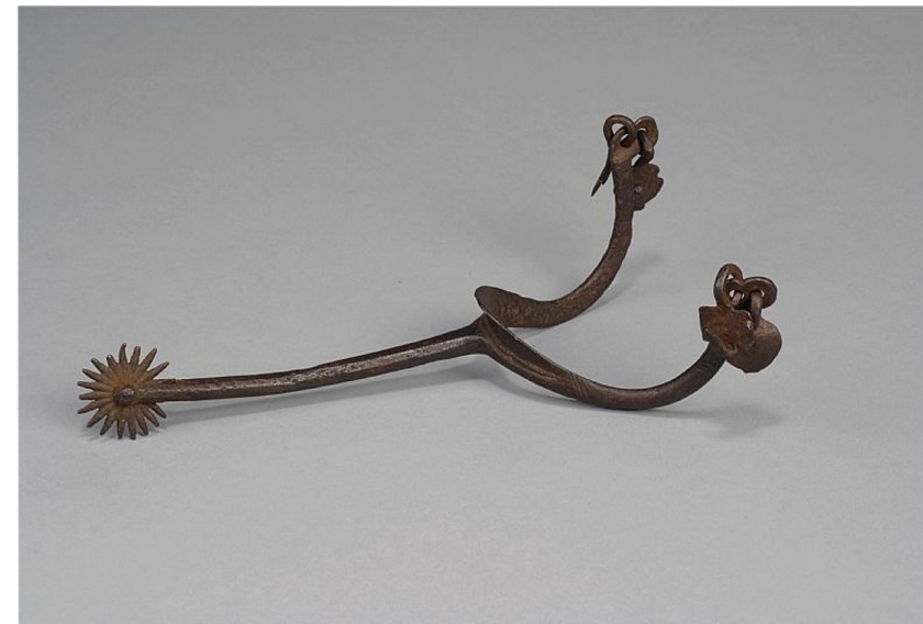
Fig. 9. Sporren från Falebro, Uppland.

talande exempel är det par långa stjärnris-sporrar med krönta minuskel-S som tillsammans med en hjälm av saladtyp, en hjälmmodell typisk för det sena 1400-talet med en smal siktglipa, förvaras i Statens historiska museum i Stockholm (fig. 8). 36 Vapengarnityret, som traditionellt går under beteckningen "Sankt Olavs hjälm och sporrar", har funnits i museets samlingar sedan 1865. De hade då varit uppsatta som trofé i Stockholms Storkyrka ända sedan de sades ha rövats från Trondheims domkyrka av Erik XIV:s trupper 1564. 37 En annan, mer trolig uppgift, är att de istället tagits på Steinvikholms slott. 38 De kan i vilket fall som helst knappast ha tillhört kung Olav Haraldsson († 1030), eftersom de på stilistiska grunder med säkerhet kan dateras till senare delen av 1400-talet. Göran Axel-Nilsson har framkastat tanken att