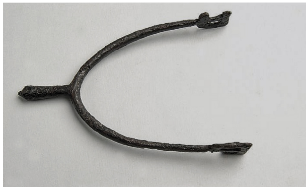
Fig. 1. Piksporre av jÄrn frÄn Borg, Östergötland. Statens historiska museum.

Iron spur from Borg, Östergötland. 12th century. The Swedish History Museum, Stockholm.