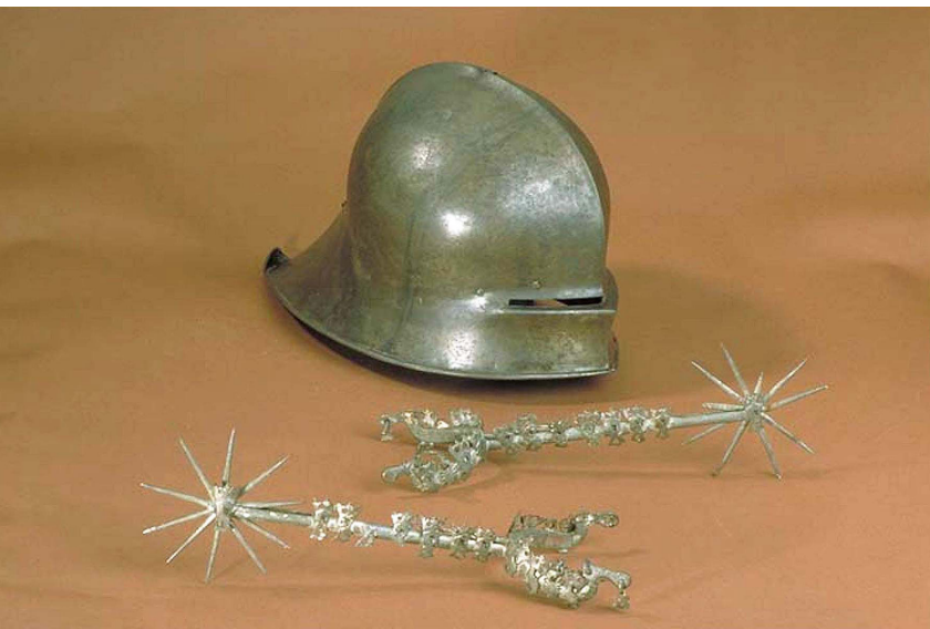
Fig. 8. De s.k. "Sankt Olavs hjälm och sporrar". Foto Statens Historiska Museum, Stockholm.

The so-called "Spurs and helmet of Saint Olav". The Swedish History Museum, Stockholm.