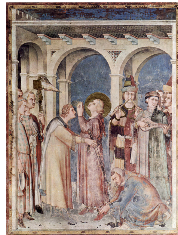
Fig. 6. St Martin dubbas till riddare. Fresk av Simone Martini, San Francesco, Assisi.

att rena den blivande riddaren symboliskt från jordiska synder innan han ikläddes en vit klädnad sammanhållen av ett bälte. Dessa symboliserade viljan att tjäna Guds lag och att stå emot köttsliga frestelser. Efter detta försågs han med sporrar och svärd, som hade välsignats av en präst, en ritual som visar att riddardubbingen vid denna tid var lika mycket en religiös angelägenhet som en social positionering. 25 Det är inte känt hur de svenska riddardubbingarna gått till, men troligt är att de följde kontinentala förebilder. 26 Heliga Birgitta beskriver i en av sina uppenbarelser en riddardubbing, men det är sannolikt att de