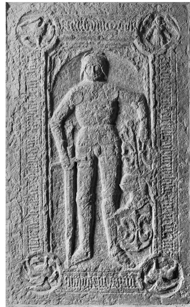
Fig. 5. Folke Gregerssons (Lillie) gravsten i Strängnäs domkyrka.

vandlas från en ren hovkultur till en mer borgerligt inriktad ämbetsmannakultur. 17 Kanske är detta förklaringen till en del av de tendenser som kan anas i frälsets visuella manifestationer åren efter sekelskiftet 1500. Grundstenen till Glimmingehus lades 1499 av Jens Holgersen Ulfstand. 18