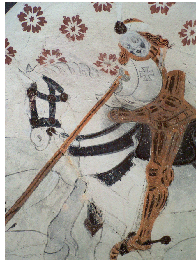
Fig. 7. St Görans och draken. Kalkmålning av Albertus Pictor, 1480-tal. Härkeberga kyrka, Uppland.

I bildkonsten bär ofta förutom riddaren även kungar sporrar för att markera sin samhällsposition och status. Detta gäller såväl Valdemar Atterdag som Bibelns Heliga tre Konungar. I Sankt Peders kyrka i Næstved, Danmark, lät sig Valdemar Atterdag († 1375) avbildas som stiftare, försedd med sporrar och knäböjande vid en framställning av "Nådstolen" tillsammans med sin hustru drottning Helvig. Flera andra exempel på sporr-försedda stiftare finns i det danska kalkmåleriet. I fallet med Heliga