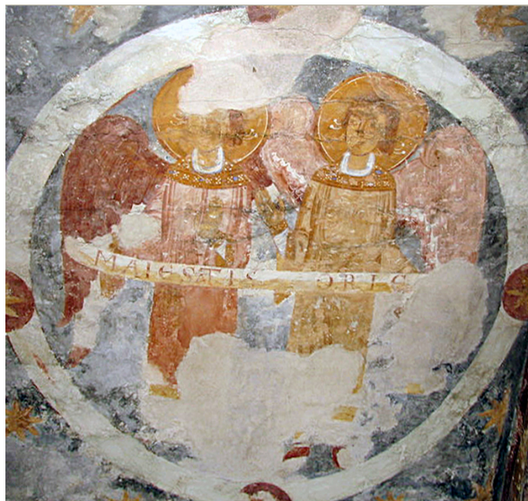
Fig. 5. Vä Kirke. Medaljon med to diakonengle, deres hoveder er velbevarede og har bånd omkring håret fra et oprindeligt diadem.

Vä Church. Medallion with two deacon angels. Their heads are well preserved and have ribbons from an original diadem surrounding their hair.