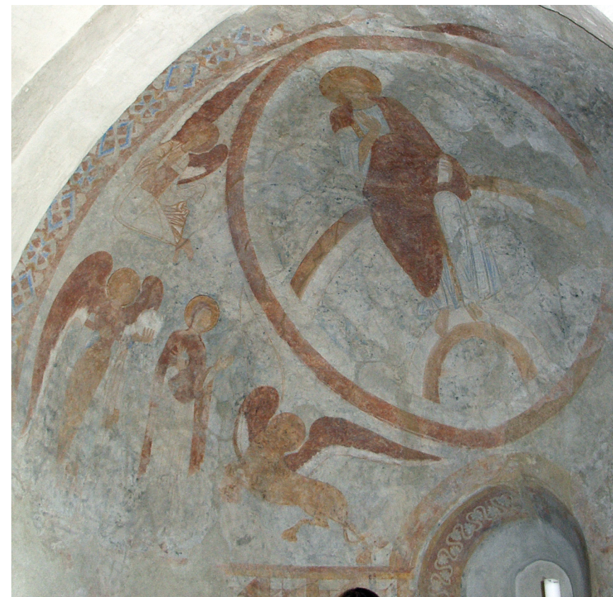
Fig. 8. Sønder Jernløse Kirke, 1125. Majestas Domini i apsis er flankeret af en ærkeengel ved Marias side.

rens ven og pengene var. I huset var en stor sorg. Den eneste datter havde holdt bryllup syv gange. Men hver gang var der på bryllupsnatten sket en katastrofe. Et monster viste sig ved sengen, og dræbte brudens ægtefælle. Nu ville ingen gifte sig med hende, men den unge Tobias friede efter opfordring fra sin følgesvend til hende. Glad arrangerede faderen et stort bryllup, men alle frygtede for Tobias' liv. Ledsageren rådede ham til, at tage fiskehjertet med i brudekammeret. Monstret viste sig og truede Tobias med at dræbe ham, men han gav det i stedet fiskehjertet, og monstret forsvandt. Så forærede datterens far Tobias et stort følge og masser af varer og penge, så han herskabeligt kunne tage tilbage til sin blinde gamle far. Da Tobias kom hjem, bad ledsageren ham om at lave en salve af fiskens galde. Det skulle han smøre sin fars blinde øjne med, og straks blev han igen seende. Tobias' far ville belønne ledsageren for alle hans gode råd og kloge adfærd, men han nægtede at tage imod gaver. Han blev så spurgt om, hvem han egentlig var, og da svarede ledsageren: "Jeg er Rafael, én af Herrens syv engle", altså en ærkeengel. I Alsted Kirke midt på Sjælland har man, dengang det store Jørlundeværksted malede i kirken på Hvideslægtens bestilling, kendt denne historie, siden man navngav ærkeenglen: Rafael.