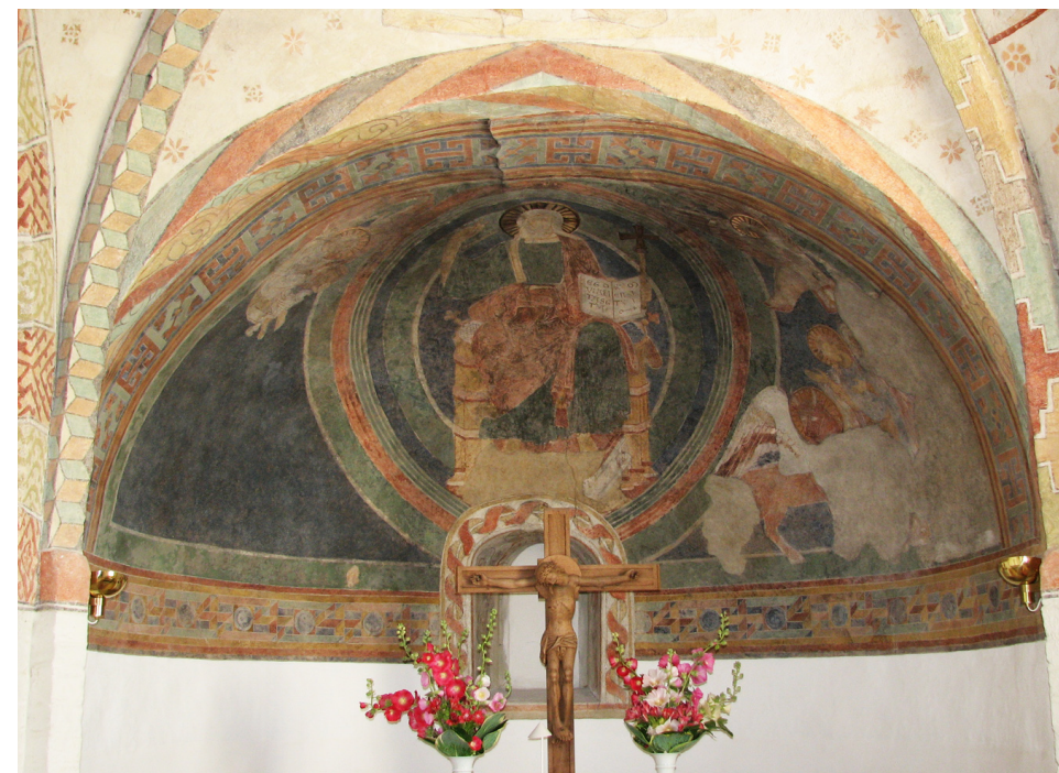
Fig. 13. Vester Broby Kirke. Apsis. Majestas Domini.

I 1893 afdækkede restaurator Julius Magnus-Petersen den bevarede nordre halvdel af apsisudsmykningen i Slaglille Kirke: Marcusløven og Matthæusenglen samt den forbedende Jomfru Maria. Han gen-