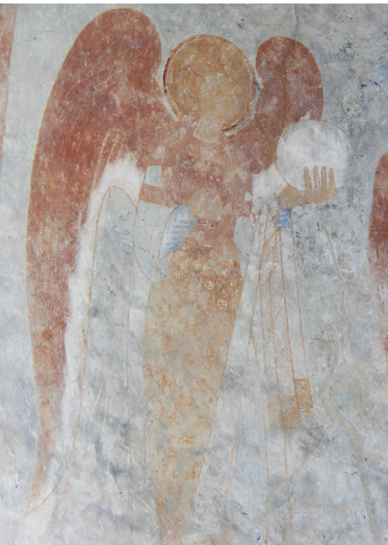
Fig. 9. Sønner Jernløse Kirke, 1125. Ærkeenglen.

Sønner Jernløse Church, 1125. An archangel.