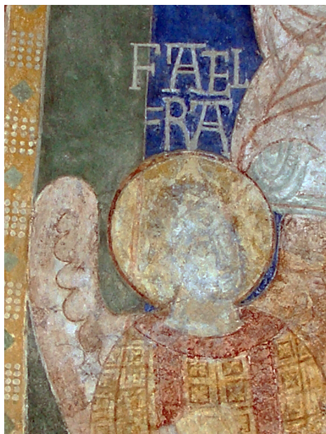
Fig. 7. Alsted Kirke. Detalje af ærkeenglen i apsidens nordre del med navneindskriften Rafael. Foto Ulla Haastrup.

Alsted Church. Detail of archangel on the apse's northern section, with the name RAFAEL above.