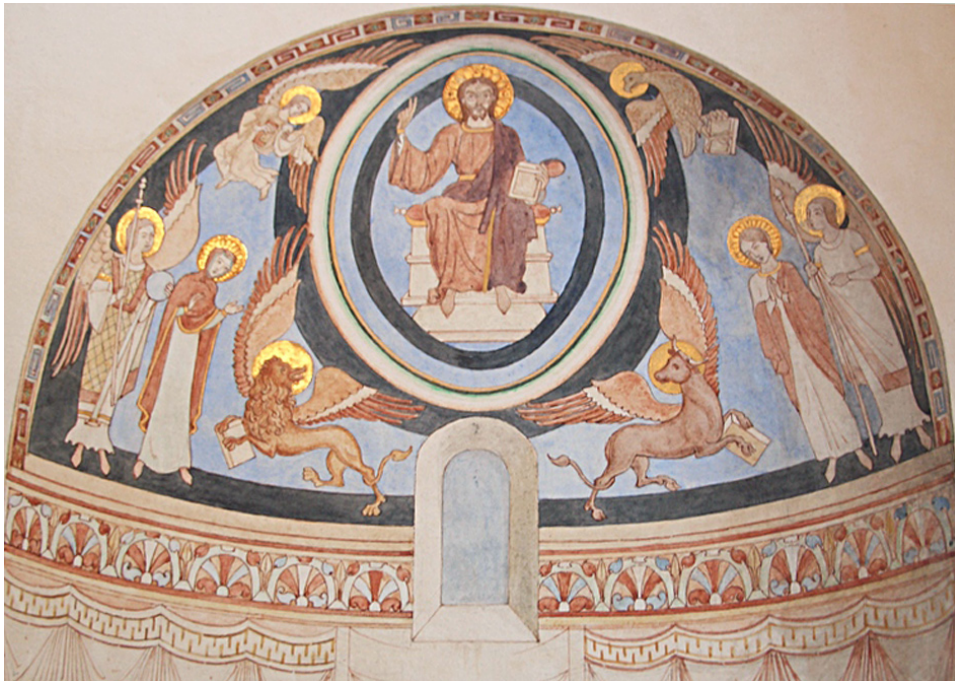
Fig. 1. Hagedsted Kirke. Akvarel af J. Kornerup, 1862, Nationalmuseet, København. Majestas Domini med Maria, Johannes og flankerende ærkeengle. Mattheusengel overst til venstre.

Hagedsted Church. Watercolour by J. Kornerup, 1862, in the National Museum, Copenhagen. Christ in Majesty with the Virgin Mary, St. John and flanking archangels. Upper left symbol of Matthew the Evangelist.