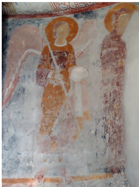
Fig. 2. Vä Kirke, 1121. Apsisudsmykningens nedre zone, freske af ærkeengel og Jomfru Maria i nord-siden.

Vä Church, 1121. Northern side of the lower section of the apse, fresco with archangel and the Virgin Mary.