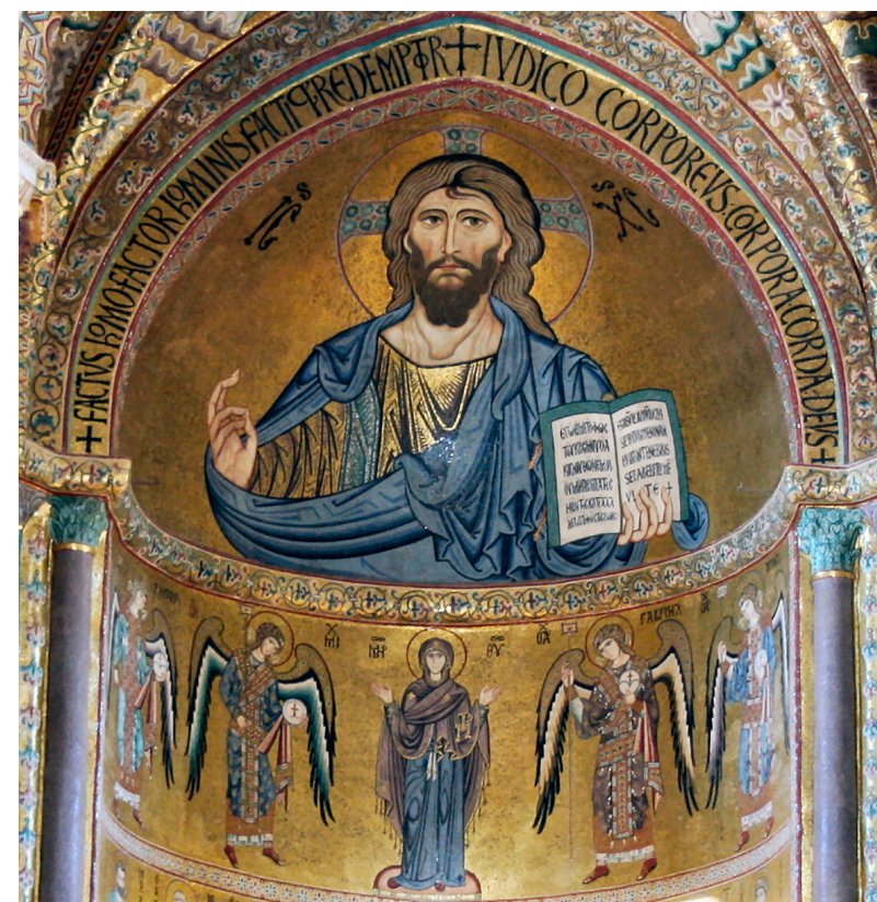
Fig. 23. Domkirken i Cefalù, Sicilien. Mosaikkerne i hovedapsis fuldført o. 1148. Pantokrator i halvfigur ses øverst, berunder en billedzone med Maria som orant flankeret af i alt fire ærkeengle. Cefalù Cathedral, Sicily. The mosaics in the apse completed c. 1148. Christ Pantokrator in half figure, below four archangels flanking the Virgin Mary as an orant.

Herunder en fremstilling af de tolv apostellam samlet omkring Korslammet over østvinduet. Den store billedfrise nederunder viser to gange fire martyrer med kroner samlet om en (ødelagt) tronende Maria Regina, som er flankeret af ærkeengle med kosmoskugle og stav med labarum (fig. 22). En uidentificeret, lille stiftermunk ses ved den nordre ærkeengel. De kvindelige martyrer bærer yderst fornemme dragter af byzantinske silkestoffer i forskellige mønstre, ligesom ærkeenglene. Disse specielle udformning af hofdragterne er god parallel til de danske fremstillinger af ærkeenglenes udstyr med seler og bælte.