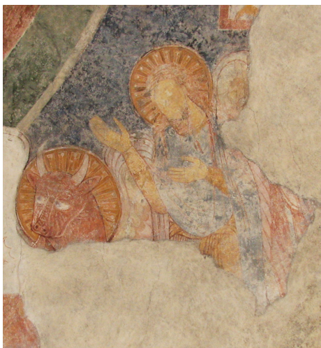
Fig. 14. Vester Broby Kirke. Apsidens nordre halvdel med Johannes Døberen og fragmenter af den ødelagte ærkeengels vinger.

På triumfvæggen er Dommedagsmotivet malet i flere billedzoner. I den øverste zone er i nord nærmest Kristus i topmedaljonen en basunblæsende halvfigursengel. Tæt på denne er et lodret stående kors malet. Det bliver holdt af en mindre, stående figur, der delvist skjules af korbuens kantornamentik, kun en sko ses (fig. 15). Figuren har glorie, velsigner med høj-