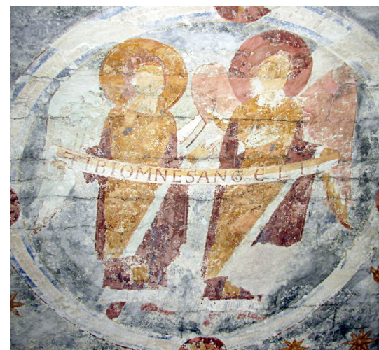
Fig. 3. Vä Kirke, 1121. Tøndehvelvet. En af medaljonerne med to ærkeengle, der holder et skriftbånd med en sætning fra Te Deum.

I den kongeejede Vä kirke, den nærtliggende forgænger til nutidens Kristianstad, findes i apsiskuplen Majestas Domini sidende på regnbuen i mandorla og omkring Kristus evangelistsymboler med seks vinger hver. I billedzonen herunder er kun to figurer bevaret i nordsiden (fig. 2). Nordligst en stående ærkeengel iført en dragt med seler og bælte, med mønstret – kun ganske svagt bevaret – silkestof og røde sko, holdende en stav med liljetop og en kosmoskugle. Over den venstre hånd med kuglen hænger et hvidt manipelbånd. Englen ledsager en forbedende Jomfru Maria.