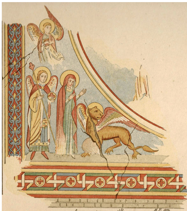
Fig. 12. Slaglille Kirke. Akvarel af J. Magnus-Petersen 1893, Nationalmuseet, København. Den nordre del af apsis viser Majestas Domini flankeret af Jomfru Maria og en ærkeengel. Efter J. Magnus-Petersen 1895.

Slaglille Church. Watercolour by J. Magnus-Petersen, 1893. The northern part of the apse depicts Christ in Majesty flanked by the Virgin Mary and an archangel.