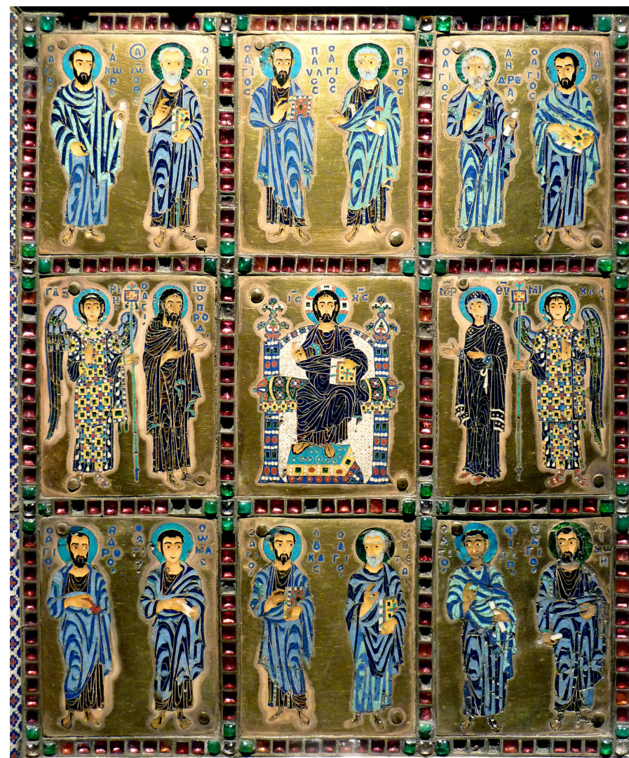
Fig. 18. Stauroteket, o. 960, i Domschatz und Diözesanmuseum, Limburg an der Lahn, Hessen. Fra S. Sophia i Konstantinopel. Detalje af relikviebeholderens låg smykket med emaljer og forestillende apostlene og Deesis, der er flankeret af to ærkeengle.

Den er også ét af de fineste byzantinske guldsmedearbejder, der er bevaret. Stauroteket måler 48 x 35 cm og er prydet med ædelstene, perler, filigran og ikke mindst fremragende emaljearbejder i celle (cloisonné) teknikken. Under plyndringen af Konstantinopel i 1204 af korsfarere fra