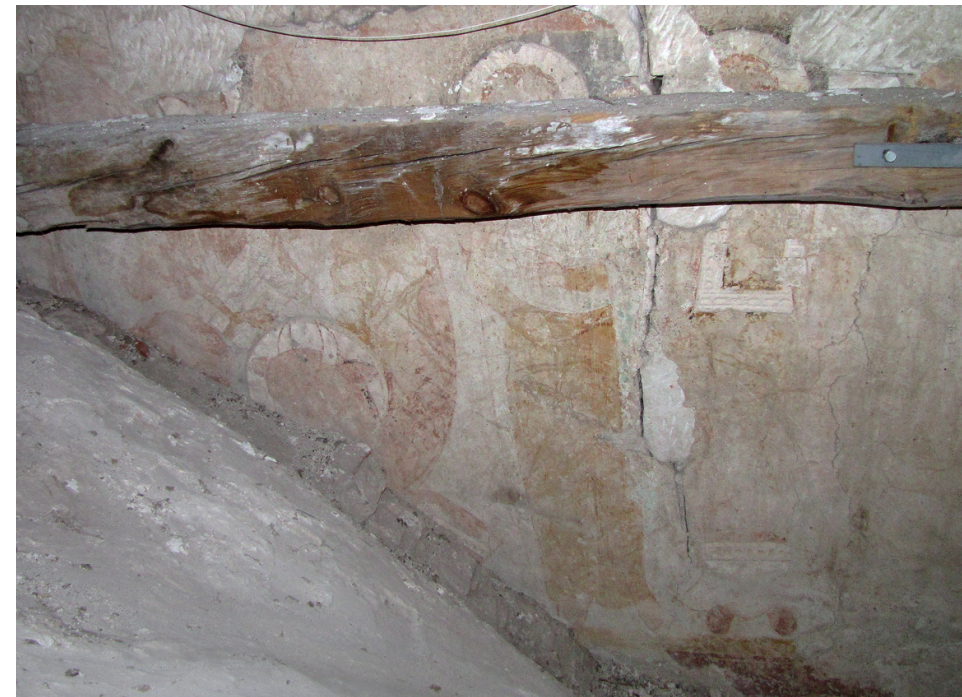
Fig. 10. Holme Olstrup Kirke, triumfvægens sydlige halvdel. Majestas Domini omgivet af Johannes og en ærkeengel. Fresko med stukdetaljer bevaret over de senere indbyggede gotiske hvælvinger.

I Butterup Kirke, som ligger nær ved Hagedsted, fandt man rester af en Majestas Domini i apsis, malet af Jørlundeværkstedet. Der er kun små figurfragmenter tilbage og dele af lavfrisens ornamentik. Fødderne af Jomfru Maria, forkroppen af Marcusløven og det nederste af en stående ærkeengel er de eneste rester, der er bevaret. Ærkeenglens røde sko, den nederste del af den hvide kjortel og lidt af den mønstrede silkeoverdragt er tilbage, men det er tilstrækkeligt til, at man genkender en ærkeengel, ligesom den i Hagedsted.