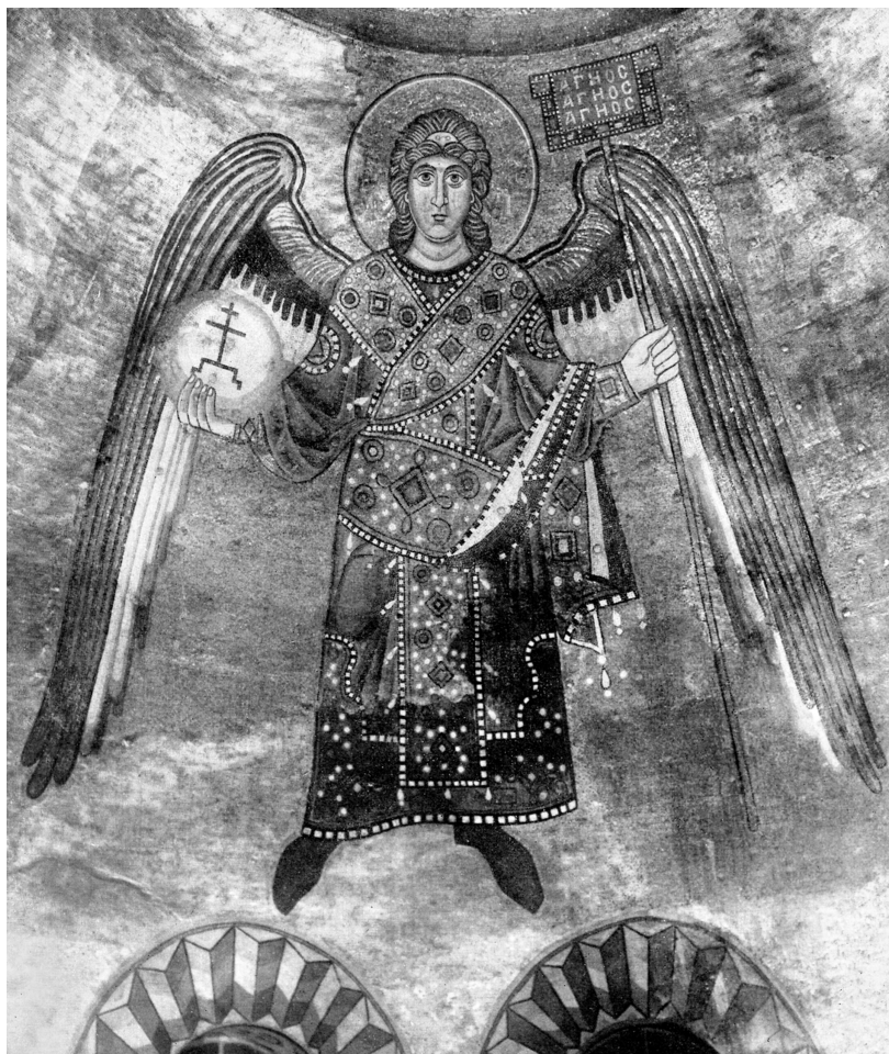
Fig. 20. Kiev, Katedralen S. Sofia, 1046. Hovedkuppelens mosaik. Den eneste bevarede af oprindeligt fire ærkeengle, under Pantokrator. Efter Lazarev 1966. Kiev, St. Sophia Cathedral, 1046. Mosaic. The only remaining archangel of the original four beneath the Pantokrator in the dome.

ligste relikvie, som det nøgne træ smykket med store ædelsten og perler, men uden et billede af den korsfæstede Kristus. Heller ingen sørgende ved korset er gengivet.