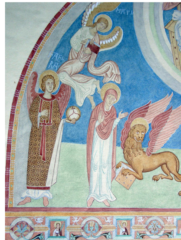
Fig. 6. Alsted Kirke. Akvarel af J. Kornerup, 1892, Nationalmuseet, København. En detalje af Majestas Domini i apsis (den nordre halvdel), ærkeenglen Rafael og Jomfru Maria.

I Vä Kirke findes, som nævnt, bevaret én ærkeengel i forbindelse med apsidens Majestas Domini, i den nedre billedzone mellem vinduerne, hvor også Jomfru Maria står. I tøndehvælvets store demonstration af Te Deum-teksten er mange engletyper repræsenteret, heriblandt også fire ærkeengle. I tårnets kongelige galleri er på rummets østvæg endnu bevaret nogle samtidige rester af "almindelige engle". Ingen andre bevarede, skandinaviske kalkmalede udsmykninger tæller så mange engle og af så forskellige rangklasser.