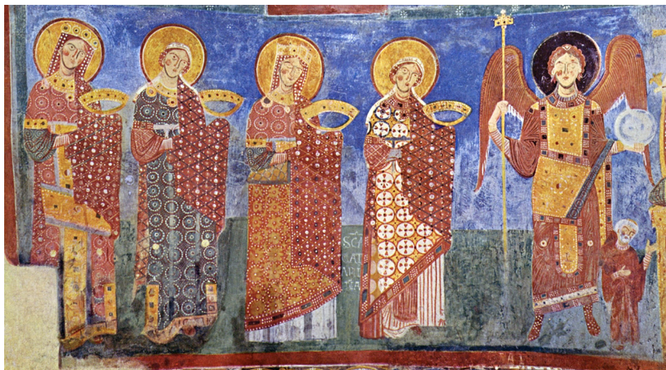
Fig. 22. Basilica di Sant'Elia (Sant'Anastasio) i Castel Sant'Elia, Italien. Slutningen af 1000-tallet. Fresko i apsis, nordsiden af den nedre billedzone, kvindelige martyrer og en ærkeengel (på ærkeenglens venstre side findes en delvist ødelagt, tronende Maria). Konstvetenskapliga arkivet, Åbo Akademi.

Basilica of Sant'Elia, in Castel Sant'Elia, Italy, late 11th century. Fresco in the lower, northern register of the apse, showing female martyrs and an archangel (on the archangels left side the enthroned Virgin Mary, partly destroyed).