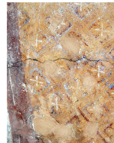
Fig. 4. Detalje af fig. 3, det velbevarede maleri af det byzantinske silkestof i den ene ærkeengels klædedragt.

Vä Church, barrel-vault fresco. One of the medallions depicting two archangels holding a banner with a phrase from Te Deum.