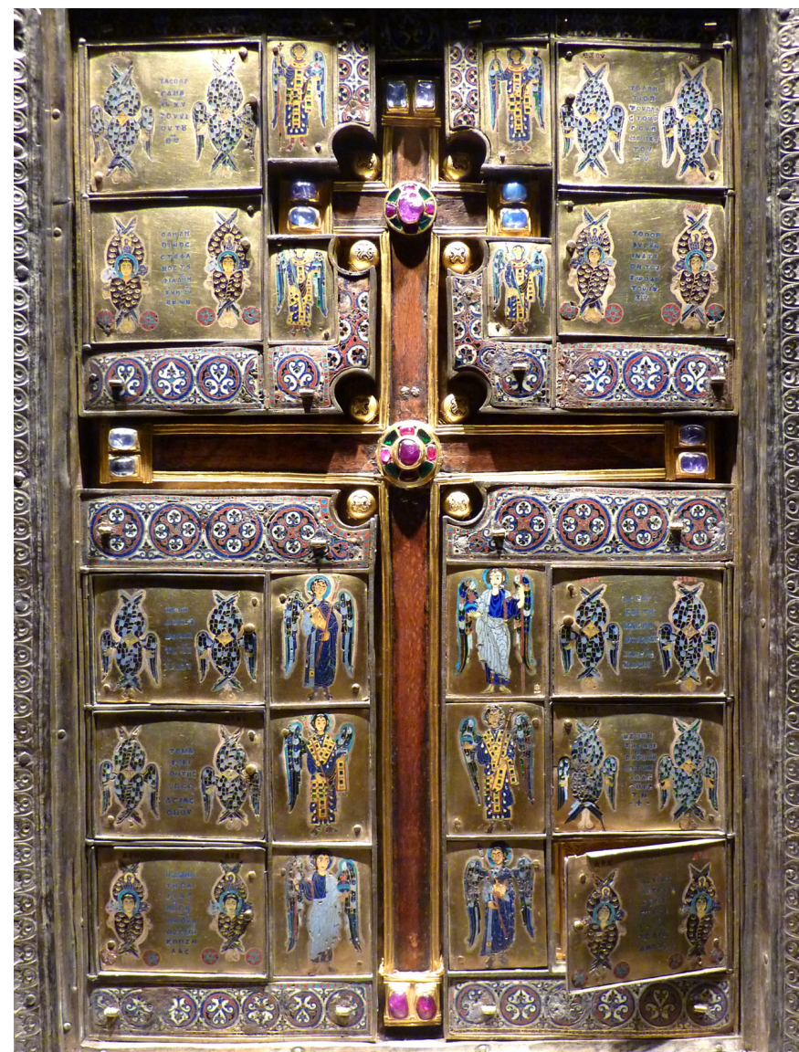
Fig. 19. Stauroteket, o. 960, i Domschatz und Diözesanmuseum, Limburg an der Lahn, Hessen. Fra S. Sophia i Konstantinopel. Relikviebeholderen. Omkring Korstræet er emaljer forestillende ærkeengle i forskellige hofdragter, samt serafer og keruber.

Billedprogrammet består omkring korset udelukkende af de forskellige rangordener af engle. På låget er alene Deesisgruppens tre figurer, ledsaget af to særligt klædte ærkeengle og de tolv apostle. Kristus, Maria og Johannes Døberens relikvier indgår jo også i Stauroteket. Der er ingen episke motiver. Korstræet, i form af et patriarkalkors, står som den væsent-