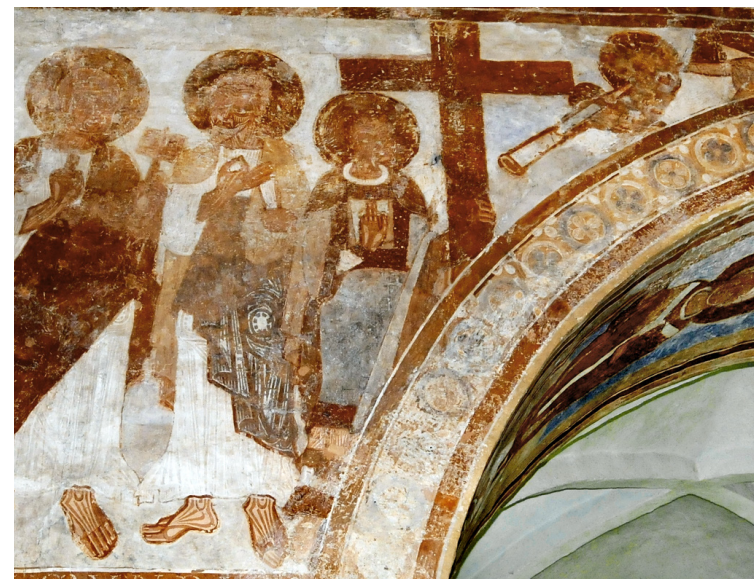
Fig. 15. Finja Kirke. På den nordre del af triumfvæggens Dommedagsscene er en korsholdende ærkeengel, nu uden vinger.

re hånd og er iført en dragt med seler og bælte samt en underdel af mønstret stof, herunder er en hvid underkjortel. Figurens venstre arm bærer et langt, nedhængende manipellignende klæde. Ud fra denne beskrivelse ville man sige: "Dette er en ærkeengel." Men... vingerne mangler i den nuværende bevaringssituation. Mange andre dele af udsmykningen er også gået tabt. Ikke mindst den oprindelige kraftigt blå lapis lazuli baggrund. I andre Dommedagsfremstillinger, f. eks. i Skt Ib Kirke i Roskilde og i Måløv Kirke, holder engle korset, men i disse udsmykninger har englene ikke andet end almindelig engledragt, kjortel og kappe.