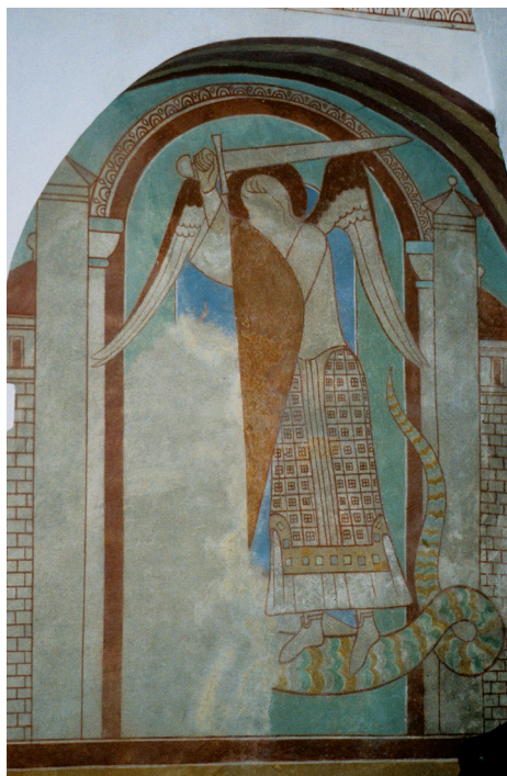
Fig. 16. Hvorslev Kirke. Triumfvæggens sydlige sidealterbillede. Ærkeenglen Mikael som Dragedræber.

Efter afdækningen udspandt der sig en stor brevveksling mellem konservatoren og menigheden. Rothe ville ikke rekonstruere det tabte dragehoved, men i sin restaurering i 1904 kun gengive, hvad han så ved afdækningen (fig. 16). Ærkeenglen kæmper vendt ind mod korbuen. Handlingen er indfattet i arkitekturgengivelse, tårn med kvadre, og indrammes foroven af en bue med æggestavsornament. Tårnet nærmest korbuen er rekonstrueret, men gengivet efter den tilsvarende arkitektoniske opbygning omkring den tronende Madonnafigur i nord. Denne Madonna er af den byzantinske type, Madonna Hodegetria. Vejviserinden er en bestemt Madonnatype, som i helfigur viste Jomfru Maria med Jesusbarnet på sin venstre arm og med den højre hånd pegede på barnet. En forudsigtelse af barnets senere frelsergerning. Man mente, at evangelisten Lukas havde malet dette billede, som var en stor helligdom i kejserpaladset i Konstantinopel. Utallige gengivelser i elfenben,