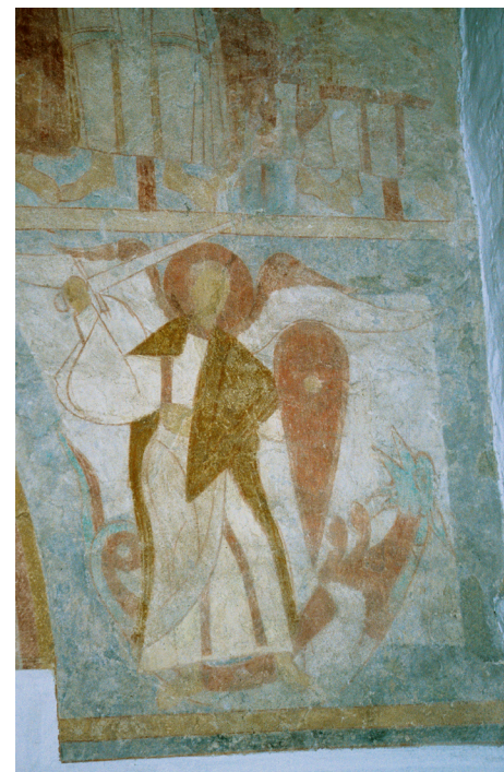
Fig. 17. Råsted Kirke. Triumfvæggens sydlige sidealterbillede. Ærkeenglen Mikael som Dragedræber.

De afblegede fresker i Råsted Kirke er udført af det samme værksted, som malede i Hvorslev. 19 Mikael Dragedræber vender i Råsted ryggen mod korbuen og kæmper med sværd mod den gruopvækkende drage, hvis hoved ses i syd. Andagtsbilledet er ikke indrammet af arkitektur, men fremstillet på grøn baggrund med blå kantbånd