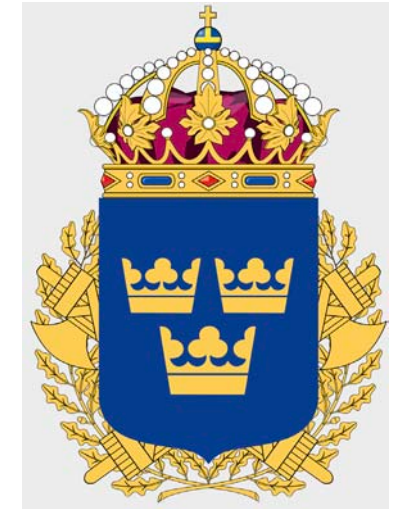
Fig. 16. Den svenska polisens emblem sedan 1926.

The coat-of-arms of the Swedish police authority since 1926.