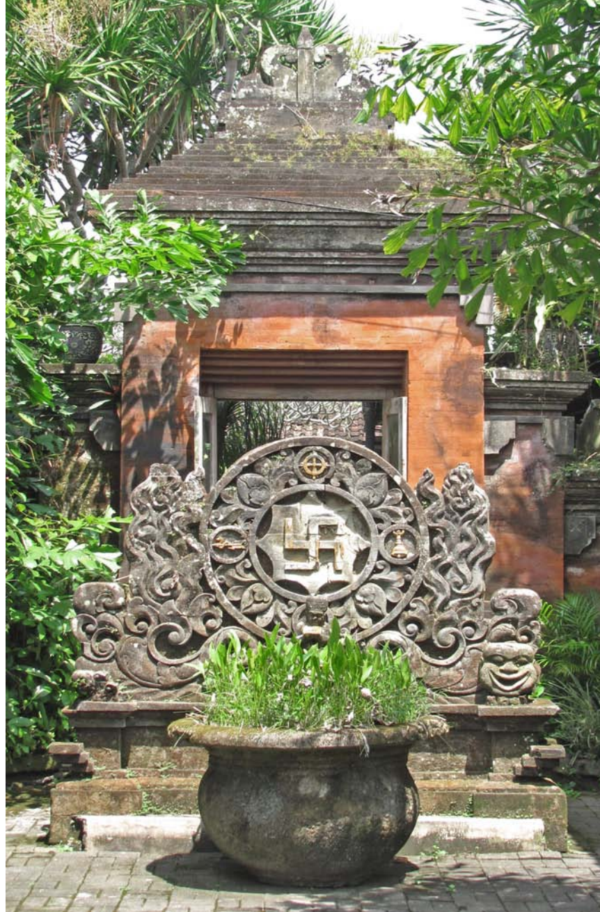
Fig. 1. Hakkors i det hinduiska templet "Pura Majaran Agung", Ubud, Bali, Indonesien. Foto "Torbenbrinker" 2014. Wikimedia Commons.

Swastika in the Hindu "Pura Majaran Agung" Temple, Ubud, Bali, Indonesia.