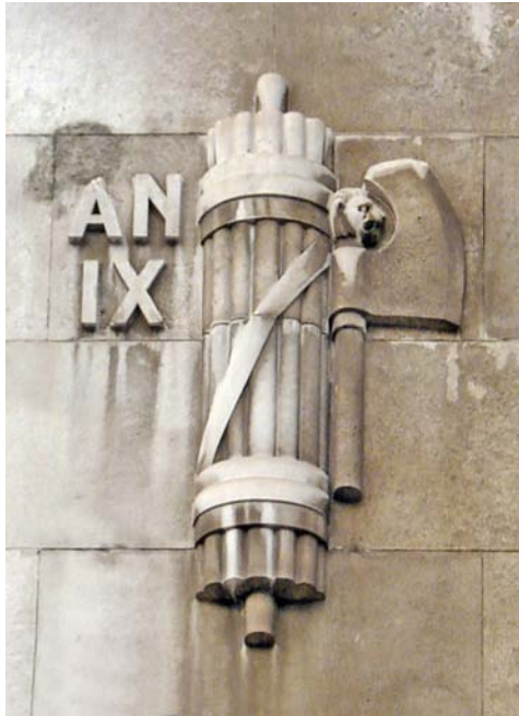
Fig. 14. Det fascistiska spöknippet på fasaden till Milanos centralstation. "AN IX" står för "Anno IX [dell'era fascista =1931]"