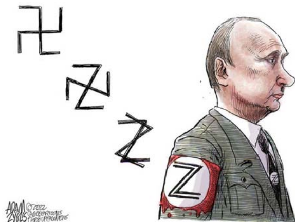
Fig. 20. Adam Zyglis, "Zwastika". Cartoon in Buffalo News, March 13, 2022: https://buffalonews.com/zwastika/image_1d1411fo-a192-11ec-98ae-23ed0250cdfd.html

Samtidigt har bokstaven Z i den ryska krigspropagandan fått en betydelse motsvarande hakkorsets, i officiella ryska media som symbol för seger eller (något senare) för fred och rättvisa. På den andra sidan, i första hand i Ukraina och större delen av Västvärlden, fick bokstaven omedelbart samma betydelse som hakkorset – som symbol för diktatur, etniskt motiverad expansion och krigsövergrepp (fig. 20). Precis som med hakkorset på 1930-talet ledde det ryska bruket av Z till att en lång rad företag tog bort bokstaven ur sina företagsnamn och varumärken, och till att den i ett flertal länder helt förbjudits i publika sammanhang. 30