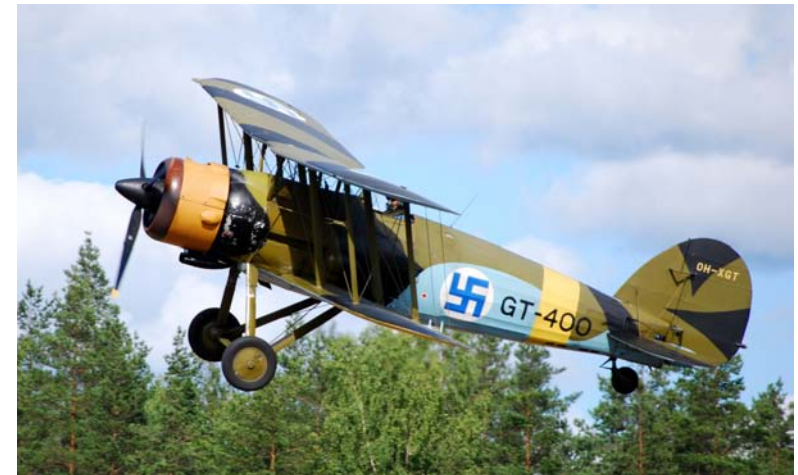
Fig. 10. Gloster Gauntlet, ett jaktplan som användes av det finländska flygvapnet 1940–1945, med sina ursprungliga nationsbeteckningar.

såväl vattenkraft som tidstypiskt natursvärmeri och fornordisk romantik (fig. 9). I Finland förekommer hakkorset, precis som i de flesta västeuropeiska länder, ofta tillsammans med andra lån från antiken Grekland och Rom i all klassicerande arkitektur, och det finländska flygvapnet hade hakkorset som symbol från 1917–18 fram till 2017 (fig. 10, 11). 20 I Danmark hade Carlsbergs bryggerier samma hakkors som varumärke och det kan fortfarande beskådas på bland annat de elefanter som pryder ingången till bryggeriets portalbyggnad i Köpenhamn (fig. 12). 21 Den sistnämnda kan ses som ett särskilt bra exempel på det slutande 1800-talets svärmeri för det orientaliska, särskilt indo-buddhistiska form- och teckenspråket. Här ingår hakkorset som en bland många exotiska komponenter – utsirade kreneleringar, lökkupoler, hörntureller – och inte