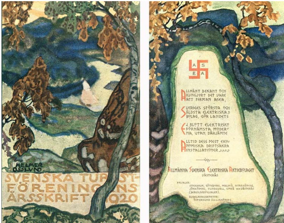
Fig. 9. Helmer Osslund, omslag till Svenska Turistföreningens årsbok 1920. Helmer Osslund, cover of the Swedish Tourist Association's yearbook 1920.

såväl vattenkraft som tidstypiskt natursvärmeri och fornordisk romantik (fig. 9). I Finland förekommer hakkorset, precis som i de flesta västeuropeiska länder, ofta tillsammans med andra lån från antiken Grekland och Rom i all klassicerande arkitektur, och det finländska flygvapnet hade hakkorset som symbol från 1917–18 fram till 2017 (fig. 10, 11). 20 I Danmark hade Carlsbergs bryggerier samma hakkors som varumärke och det kan fortfarande beskådas på bland annat de elefanter som pryder ingången till bryggeriets portalbyggnad i Köpenhamn (fig. 12). 21 Den sistnämnda kan ses som ett särskilt bra exempel på det slutande 1800-talets svärmeri för det orientaliska, särskilt indo-buddhistiska form- och teckenspråket. Här ingår hakkorset som en bland många exotiska komponenter – utsirade kreneleringar, lökkupoler, hörntureller – och inte