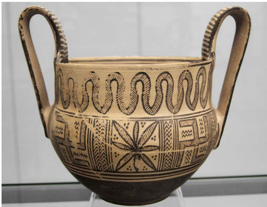
Fig. 4. Geometrisk kantharos från 700-talet BC. Staatliche Antikensammlungen, München. Geometric kantharos from the 8th century BC.

De äldsta hittills bekanta exemplen på hakkorset äro de som påträffas målade på lerkärl från Elam (sydvästra Persien) och hänföra sig till tiden mellan 4,000 och 3,000 år f. Kr. Med dem sammanhänga förmodligen senare fynd från Mindre Asien. I det gamla Troja förekommer hakkorset massvis från det andra till det femte kulturlagret [ca 2500–1750 BC]. I Europa är det första gången bekant genom fynd i Bessarabien och Siebenbürgen från den yngre stenåldern. 8 Här ha en del tyska lärda (bl.a. de, som i hakkorset se en "arisk" symbol) trott sig finna ursprungskällan. Fynden äro dock åtskilligt yngre än de elamitiska och f.ö. var denna symbol rätt ovanlig i dessa trakter.