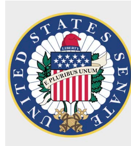
Fig. 15. USA:s senats sigill sedan 1886.

Att Mussolinis fasces (fig. 14) inte på långa vägar fått en så allmänt negativ laddning som hakkorset beror inte bara på skillnaden i storlek beträffande regimens mot mänskligheten begångna brott utan främst på spöknippets välkända ikonografi och redan etablerade, synnerligen breda användningsområden. Den historiskt någorlunda bevärdade läser det som en symbol för romersk rätt, eller "lag och ordning", medan det på ett mera allmänt plan står för enighet och styrka ("enade vi stå, söndrade vi falla"), som i den amerikanska senatens emblem (fig. 15). I den sistnämnda betydelsen har det sedan länge använts av en lång rad nationella enhetsrörelser, länder (t.ex. Kuba och Ecuador), myndigheter (t.ex. de skandinaviska ländernas polis; fig. 16) politiska partier och, inte minst, av fackföreningar och andra korporativa sammanslutningar. Spöknippet läses därför nu som symbol för fascismen nästan enbart i Italien, och där företrädesvis i historiskt avgränsade kontexter. 24