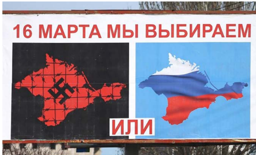
Fig. 18. Rysk valaffisch inför "folkomröstningen" för att legitimera annekteringen efter invasionen av Krim 2014.

Russian poster for the "plebiscite" to validate the annexation of Crimea after the invasion in 2014. The text reads: "On March 16 We Choose".