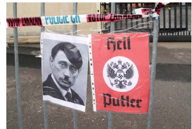
Fig. 19. Antiryska posters med Putin som Hitler och den ryska dubbelöronen försedd med hakkorsembblem. Foto Jiri Sedláček, Prague 2022. Wikimedia Commons.

I nutiden fungerar hakkorset som en bekväm etikett som politiska makthavare av olika slag vid behov klistrar på motståndare eller företeelser som man vill förnedra eller bekämpa. För det senaste, och mest flagranta, exemplet står Vladimir Putin och hans administration, som i syfte att legitimera sina expansionssträvanden konsekvent klassificerar den ukrainska regimen som rasistisk och nazistisk och följaktligen i krigspropagandan förser den med hakkors som tecken på detta (fig. 18). Givet det ryska anfallets likhet med nazisternas under andra världskriget framstår det inte som särskilt underligt att Putin i Ukraina omtalas ("Vladolf Putler") och porträtteras som Hitler och förses med hakkors (fig. 19). 29 Båda sidor använder sig nu alltså av hakkorset som symbol för den andra sidans ondska.