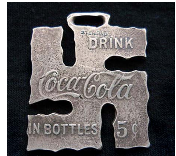
Fig. 8. Coca Cola, kedjehänge för fickur 1925. Coca Cola, watch fob pendant 1925.

I Sverige hade ASEA (Allmänna Svenska Elektriska Aktiebolaget, numera ingående i ABB) fram till nazisternas maktövertagande 1933 hakkorset som logotyp, sannolikt på grund av dess likhet med roterande kraftverksturbiner – som på kartor från tiden markeras med just hakkors. 19 På Helmer Osslunds omslag till den svenska turistföreningens årsbok 1920 associeras varumärket med