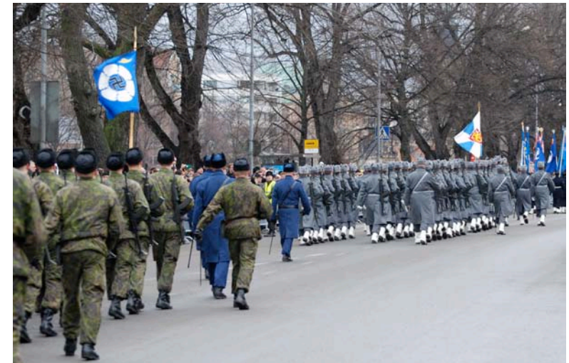
Fig. 11. Foto taget vid Finlands årliga militärparad, hållen i Åbo 2008, visande det finska flygvapnets fana.

Gloster Gauntlet, a fighter aircraft used by the Finnish Air Force 1940–1945, with its original national insignia.