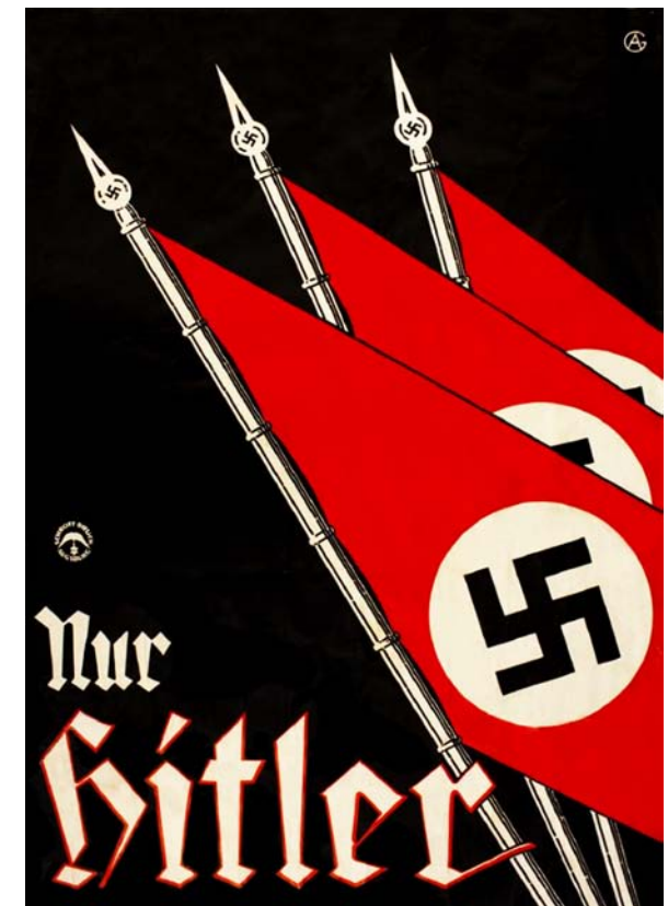
Fig. 3. Nationalsocialistiska tyska arbetarpartiets (Nationalsozialistische Deutsche Arbeiterpartei, NSDAP) valaffisch till riksdagsvalet i november 1932.

Enligt Hitlers definition betydde "arier" (en beteckning som hämtats från Indien och Iran) i princip enbart det rent germanska, nordiska "herrefolket" som i kamp med i första hand judarna tävlade om världsherraväldet. Alla andra folkslag var rasmässigt underlägsna "Untermenschen": slaver, ungrare, ryssar, med flera, liksom dåtidens "degenererade" greker och italienare. 4 Bakom formuleringen ligger en sen förändring av termen "arier". Den indikerade ursprungligen enbart en uråldrig språklig och religiös kultur med sina rötter i stäpperna