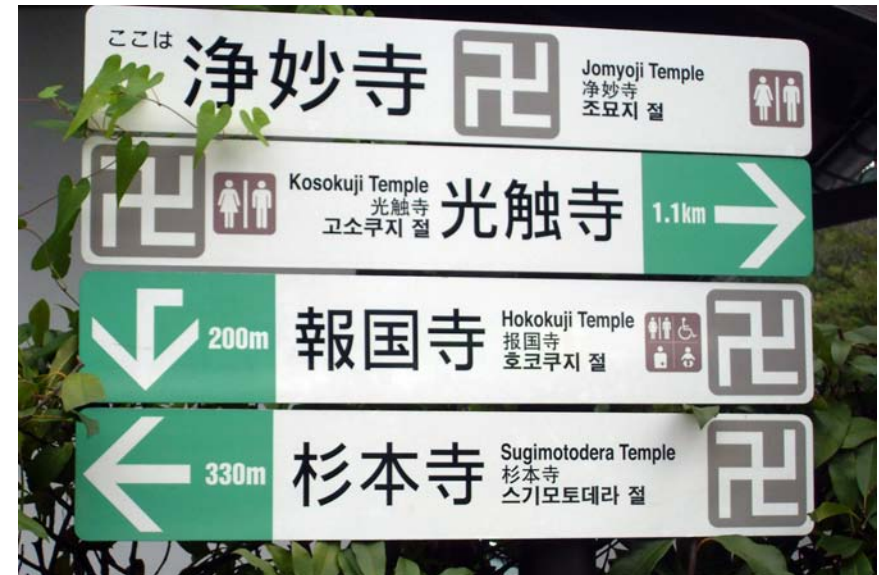
Fig. 17. Turistinformation rörande buddhistiska tempels lokalisering i Kamakura, Japan. Foto "Wicki" 2009. Wikimedia Commons.

Vad gäller approprieringen så utgår Küchen från att hakkorset är ”ett asiatiskt tecken” och känner uppenbarligen inte till att det förekommit frekvent i Europa sedan senpaleolitisk tid, d.v.s. långt tidigare än i Indien och Ostasien. Att ”västerländskt bruk av hakkorset” därför ”signalerar anspråk på en kulturell överordning som är större och äldre än nazismen” är direkt felaktigt: vad Hitler & Co approprierade var en symbol som de i första hand associerade med ”ariska” gener och kultur, som de tillskrev germaner, greker och romare. Att välja ett ”asiatiskt tecken” skulle ha varit dem helt främmande. Inte heller blir det