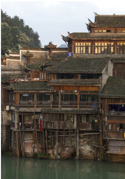
Bostadshus av typen Diao Jiao Lou (吊脚楼) i Hunan-provinsen.