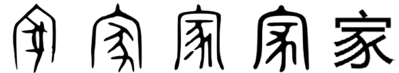
Utveckling av tecknet för hem från 1600 f.kr. (längst till vänster) till dagens användning (längst till höger). Bilder: Wiktionary.

Grisar domesticerades i det som är dagens Kina för över 9000 år sedan (De Mello 2012:86). Grisens stora betydelse för den kinesiska civilisationen kan ses rent bildligt i det kinesiska tecknet för hem 家 som har just en gris 豕 i sig: