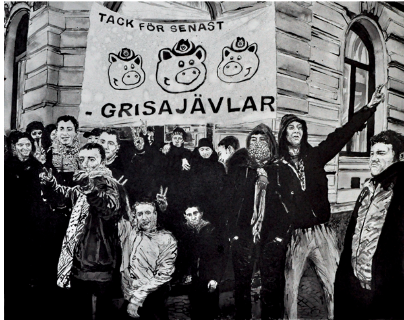
”Grisajävlar” av Viktor Rosdahl. Tusch och ägg på duk. 120 x 80 cm. 2010.

som inför julen 2019 när djurrättsorganisationen Djurrättsalliansen avslöjade misskötsel på en av Sveriges prisbelönta grisgårdar, bland annat var det grisar som vadade i avföring och döda grisar som låg kvar bland levande. 1 Men bilder som dessa tycks falna snabbt, till jul åter förmodligen ändå de flesta i Sverige gris.