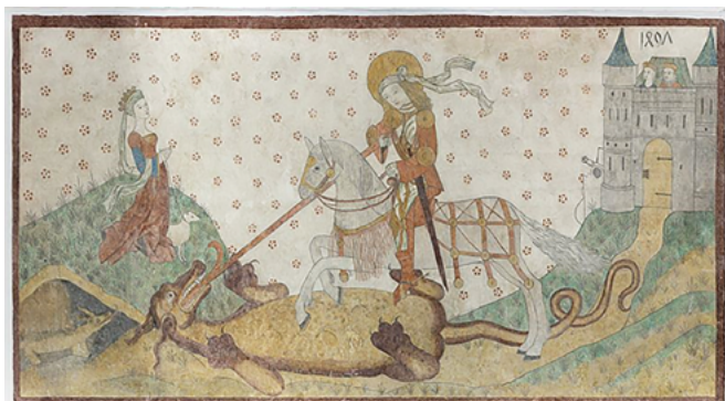
Kalkmaleri af Sankt Jørgen og dragen fra Århus Domkirke. 1400-tallets sidste halvdel.

i dette formsprog, men disse er fåtallige. Formsproget genfinder man desuden hvis man kigger nærmere på illuminerede manuskripter fra resten af Europa og derfor er formsproget ikke enestående for nordisk middelalder. Indtil videre skal disse eksempler dog opfattes som udtryk for idealer idet eksemplerne bl.a. er hentet fra afbildninger og figurer af helgener, som ikke nødvendigvis udtrykker eksempler som repræsenterer en realistisk anvendelse af hesten.