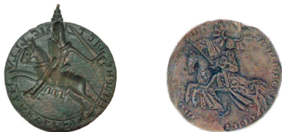
T.v.: Karl Döves sigil fra 1200-tallet. T.h.: Erik Magnussons sigil fra begyndelsen af 1300-tallet. Det var samme Erik Magnusson som fejrede sit bryllup med dust og behordb, og denne afbildning kan være et bud på, hvordan han så ud når han deltog i ridderlegene.

i dette formsprog, men disse er fåtallige. Formsproget genfinder man desuden hvis man kigger nærmere på illuminerede manuskripter fra resten af Europa og derfor er formsproget ikke enestående for nordisk middelalder. Indtil videre skal disse eksempler dog opfattes som udtryk for idealer idet eksemplerne bl.a. er hentet fra afbildninger og figurer af helgener, som ikke nødvendigvis udtrykker eksempler som repræsenterer en realistisk anvendelse af hesten.