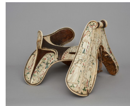
Sadel fra Kunsthistorisches Museum i Wien, dateret til 1455. Overfladen er belagt med ben, men kernen er lavet af træ.

Sadlen som anvendes til eksperimentet, er en kopi af en sen 1400-tals sadel som er udstillet på Kunsthistorisches Museum i Wien. Sammenlignet med sadlen/kopien som anvendes til eksperimentet, så er der en vis lighed.