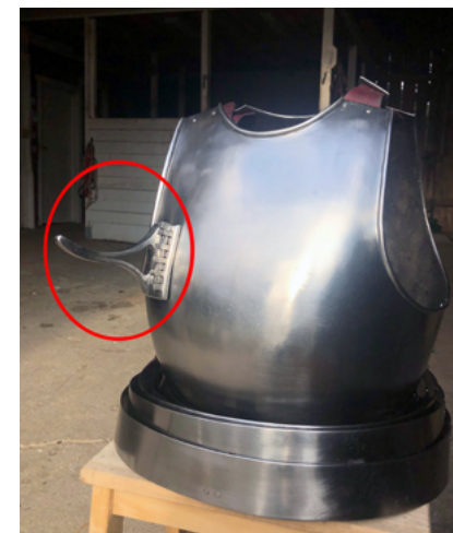
I forsøget på at genskabe middelalderens formsprog anvendtes forfatterens egen røsthage.