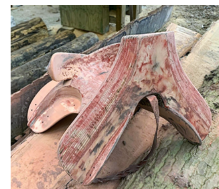
Sadlen/kopien som anvendes til eksperimentet. På billedet er sadlen under restaurering og man ser at materialet er træ ligesom originalen i Wien.

At sadlen fra Kunsthistorisches Museum i Wien er lavet af træ, er ikke enestående og der findes en del eksempler gennem hele middelalderen på, at sadler blev lavet i dette materiale (eks. Henrik 5. af Englands sadel, og sadlen fra det arkæologiske museum på Schloss Gottorf). Eftersom sadler normalt var lavet af træ i middelalderen, kan sadlen/kopien som anvendes til eksperimentet opfattes som repræsentativ for en gennemsnitlig middelaldersadel. Selvom designet af sadler ændrede sig igennem middelalderen, og der i middelalderens fandtes forskellige typer af sadler (Forgeng 2016:58-62) så vurderes det at designet ikke er afgørende for udfaldet af eksperimentet.