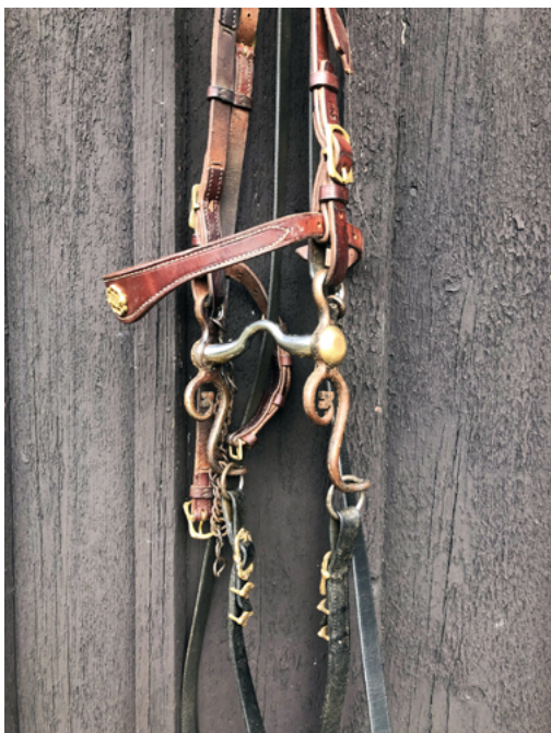
Stangbidet som anvendtes ved forsøget.