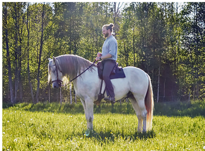
Forfatteren på den 12-årige spanske hingst Absalon, med stangmålet 165 cm.

Tilridningen og den efterfølgende dressurtræning af hesten er også essentiel for eksperimentet. Absalon blev tilredet af forfatteren på den Fyrstelige Hofrideskole i Bückeberg, ud fra idealer, principper og teknikker som stammer fra renæssancen. Det er diskutabelt om man kan anvende rideteknikker som anvendtes i slutningen af 1500-tallet/begyndelsen af 1600-tallet til at genskabe et formsprog fra middelalderen, men denne diskussion må også være genstand for videre undersøgelse. Det er dog muligt at genfinde samme idealer og praksis fra renæssancen i middelalderens ridekunst, eksempelvis at hesten skulle rides i en form med rundet og rejst hals og med venstre hånd på tøjlerne. Sidstnævnte var for at man kunne anvende højre hånd til at håndtere våben. Hestens alder hænger unægteligt sammen med træningsniveau, og en hest som Absalon der har gennemgået træning og ridning ud fra renæssancens principper i 7 år, kan opfattes som repræsentativ for samme træningsniveau og alder som en gennemsnitlig ridders hest.