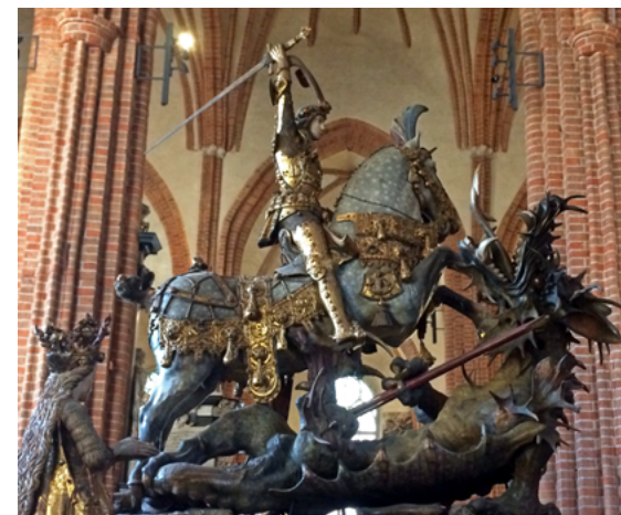
Figur af Sankt Jørgen og dragen fra Storkyrkan i Stockholm, dateret til 1400-tallets sidste halvdel.

I følgende afsnit vil hestens formsprog i historien blive diskuteret, imens diskussionen af idealet og repræsentativitet gemmes til senere.