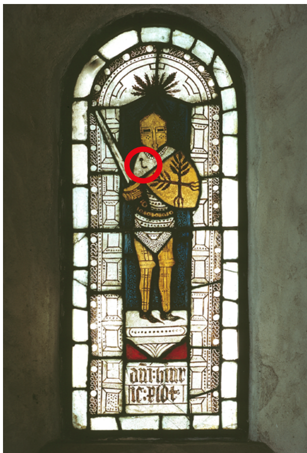
På kirkevinduet fra Døllefeldt Kirke, fra midten af 1300-tallet, ses en ridder med en røsthage på sit kyras. Røsthagen er markeret med en rød ring.

Genskabelsen af middelalderens formsprog har medført en analyse af lansestødets forskellige elementer, hvilket har påvist at der er tale om en optimering af kraftoverførsel ved at anvende førnævnte formsprog. Genskabelsen og den efterfølgende analyse har dermed eksemplificeret at det ikke er tilfældigt at kunstnere anvendte dette formsprog, men at det hører sammen med ridderens evne til at udøve vold.