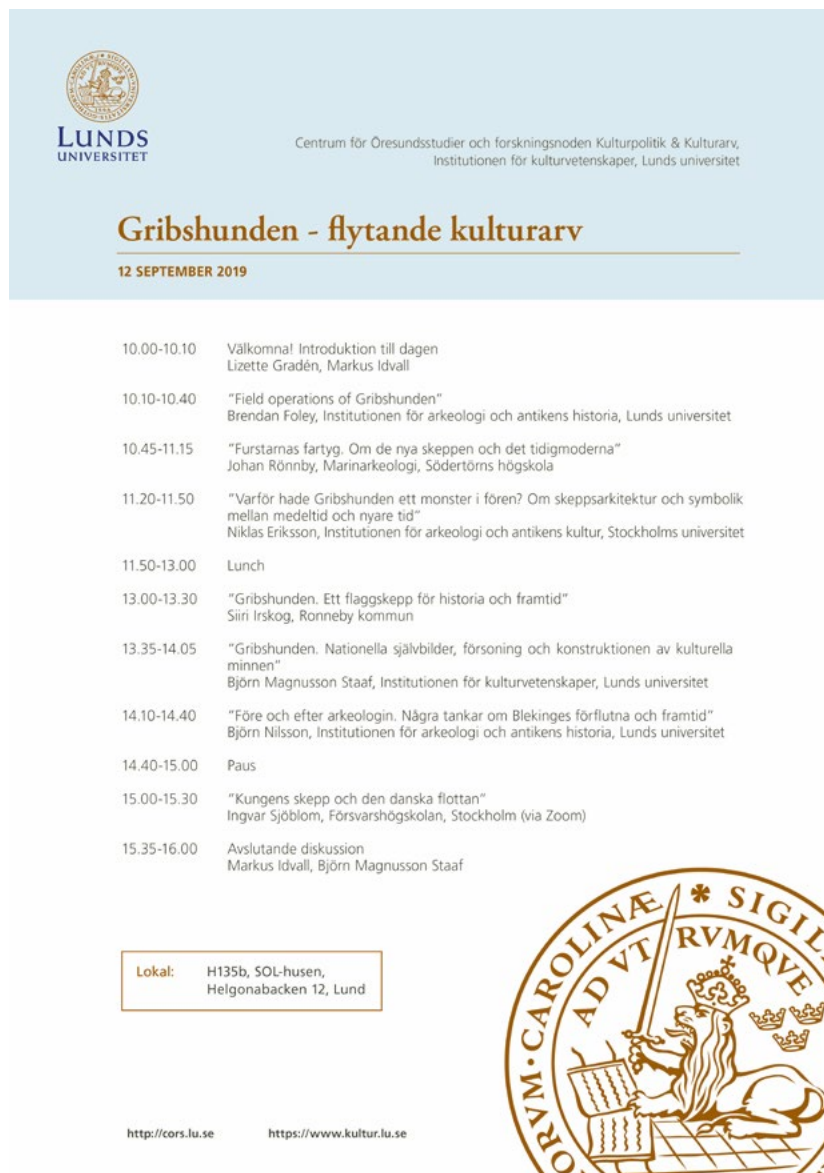
Program för seminariet "Gribshunden - flytande kulturarv"

fanns en tanke att denna skulle kunna visas upp inför en publik som inte enbart består av arkeologisk expertis. Detta beslut innebär att göra objektet till ett museiföremål, ett fynd som med stor sannolikhet kan komma att spela en viktig roll i skapandet av kulturella minnen. Dessa kulturella minnen som knyter an till ett sedan länge förflutet, kommer mer eller mindre indirekt att bidra till att forma en bild av hur tillvaro och samhälle uppfattas idag. Det är orsaken till att jag valt att försöka ge en kort historisk presentation