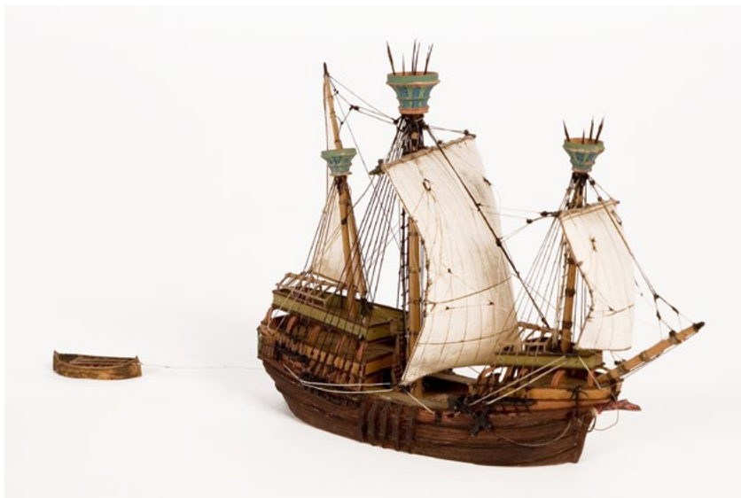
Typmodell av karack.

Köpmännen i städerna i Flandern och Nederländerna hade under medeltiden börjat bygga sin rikedom på handel med länderna längs Atlankusten och med de stora flodstäderna längs Rhen. 1400-talet skulle bli avgörande för utvecklingen av en global handel och handelsstäderna vid floderna Maas och Rhens mynningar var central i dessa processer (Magnusson Staaf 1999: 12-27). Karackerna spelade som fartygstyp också en viktig roll. De kunde bära artilleri och samtidigt ta betydande mängder last. Våld och profit kunde förenas på ett sätt som varit svårt att föra samman på äldre sorters båtar. Den nya tidens skepp deltog i de så kallade upptäcktsresorna på 1400- och 1500-talet då sjöbefälhavare från länderna längs Europas Atlankust tvingade fram handelsförbindelser med andra