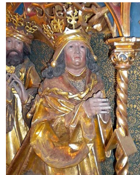
Skulptur av kung Hans gjord omkring 1530 av Claus Berg till altartavlan "Kristi Lidelseshistorie" i dåvarande Gråbrødre Kirke i Odense. Altartavlan står sedan 1885 i Sankt Knuds Kirke i Odense (även känd som Odense Domkirke). På bilden syns kung Hans son, Kristian II, på hans vänstra sida.

Hans hade dock börjat sätta svår press på Sten Sture och det var för att förhandla om ett slutligt erkännande som konung av det svenska riket som han befann sig på seglats till Kalmar ombord på Gribshunden . Skeppet var ett högst tydligt bevis för den militära makt Hans förfogade över. Gribshunden skulle göra intryck i Kalmar, men så blev det inte.