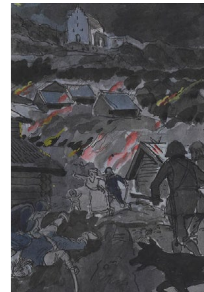
"Ronneby Blodbad", akvarell av Karl A. Petermann, 2012.

Orsaken till att Ronneby kom att drabbas så svårt är att ett mindre antal svenska soldater tagits till fånga och avrättats. Arméernas livsmedelsförsörjning byggde på plundring och avrättningarna kan ses som en form av vedergällning från lokalbefolkningen i Blekinge. Ronneby hade dessutom vägrat att kapitulera, vilket gjorde att den militära ledningen för den svenska hären såg behov av att statuera ett exempel för att knäcka blekingebornas motståndsvilja. Vad som krasst kan konstateras är att Ronneby blodbad är ett exempel på vad vi idag skulle kalla massaker på en civilbefolkning. Massakern i Ronneby tillhörde de värre under sjuårskriget, men åtskilliga snarlika hemskheter hände under hela kriget och utfördes av båda sidor. Det var inget undantag utan utgjorde en väsentlig del utav denna tids krigföring (Wittendorff 1989:310-312; Harrison & Eriksson 2010:352-356).