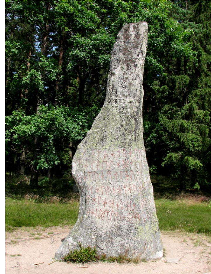
Björketorpstenen med dess förbannelsrunor är en välkänd fornlämning i Ronnebytrakten. Tre höga stenar, varav en är en försedd med runor, bildar ett triangelformat monument i anslutning till ett järnåldersgravfält. Detta är en plats som vi berättar om i utställningen Gribshunden c/o Kallvattenkuren . I projektet vill vi uppmuntra besökarna att hitta ut i landskapet till platser med historia.

I augusti 2015 skyddsbärgades stävfiguren från vraket efter skeppet Gribshunden . I hamnen Ekenäs väntade hundratals entusiastiska lokalbor och sommargäster på att få en skymt av figuren när den kom i land. Ännu fyra år senare lever en känsla kvar hos de personer som var på plats. I samtal om Gribshunden kommer oftast uttrycket ”Jag var där” och det är märkbart att Gribshunden som entitet har blivit en del av Ronnebyborna. Händelsen har både skapat stolthet hos lokalborna och blivit en nytändning i diskussionerna om ett museum i Ronneby. Denna känsla och engagemang vill vi bibehålla under den tid som fortlöper fram tills dess ett museum är på plats.