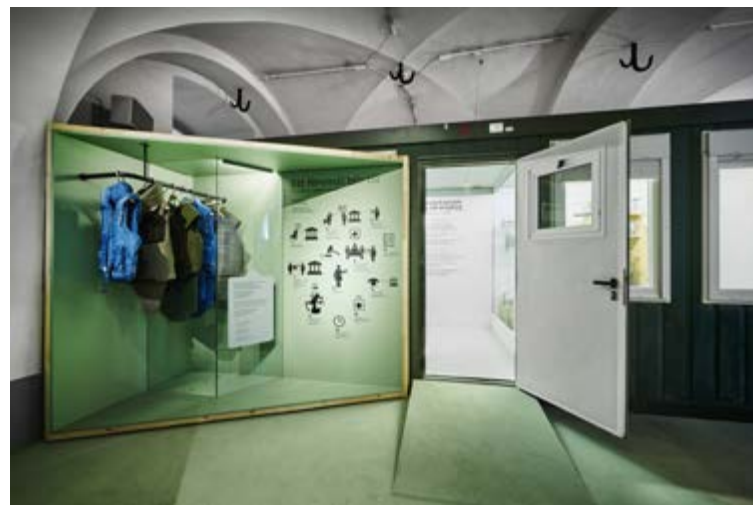
Bostadscontainern utställd i Makten och ärligheten på Armémuseum.

Alla föremål som hade tillhört soldaten i fråga samlades emellertid in till Armémuseums samlingar. Bland de 266 föremålen finns allt ifrån jordnötter, kaffe och plastblommor, till tandkräm, fotfilmar, nallebjörnar och doftljus. Det är föremålstyper som inte är särskilt vanliga i Armémuseums samlingar i övrigt. Som museiföremål får de en särskild status som kulturarv och blir en del av allt det som ska vårdas, visas och bevaras för framtiden, tillsammans med kanoner, uniformer och medaljer i samlingarna. I utställningen visas alla föremål som kommer från förläggningen i självförslutande plastpåsar, resten är