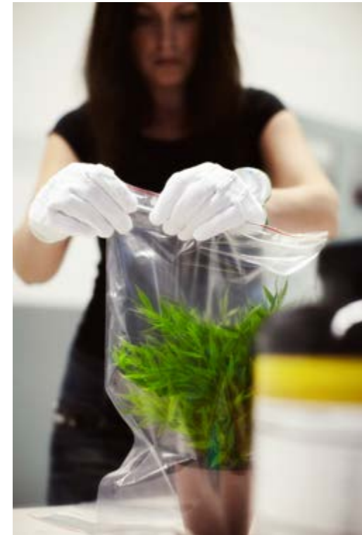
Plastblomman är ett exempel på ett föremål från bostadscontainern som förvärvades till Armémuseums samlingar och som för närvarande finns utställt i Makten och ärligheten .

rekvisita som köptes in för att efterlikna den ursprungliga inredningen i containern. Syftet med detta är att visa på statuskillnaden mellan museiföremål och andra föremål på ett museum.