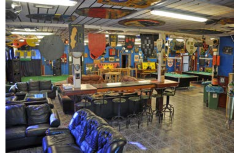
Interiörbild från mässen på Camp Victoria som fyllts med kompanisköldar och andra minnesmärken.

Museets egen målsättning med resan till Camp Victoria kom således att inriktas på att samla in en bostadscontainer med fullständig inredning, i syfte att bevara en någorlunda autentisk helhetsbild av en svensk soldats bostad på en förläggning utom-