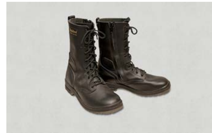
Många föremål som kommer från försvarsmakten saknar historisk proveniens.

En faktor som skiljer Armémuseums samlingar från andra kulturhistoriska samlingar är att de flesta föremål har kommit till museet från olika delar av försvarsmakten. Varje månad sänder Försvarets materielverk eller det militära Högkvarteret långa listor till de museer som ingår i myndigheten Statens försvarshistoriska museer, med information om en mycket stor mängd objekt som ska utrangeras. 2 Ofta har Armémuseum hundratals föremål att tacka ja eller nej till i samband med det månatliga insamlings- och gallringsmötet. Arbetet med att sätta sig in i vilka sorts föremål det handlar om tar tämligen stora resurser i anspråk. Ofta är det föremål som aldrig har använts. Ibland har de tillverkats i syfte att fungera som förlagor till hur en viss sak ska se ut, så kallade ”modell exemplar”. Andra