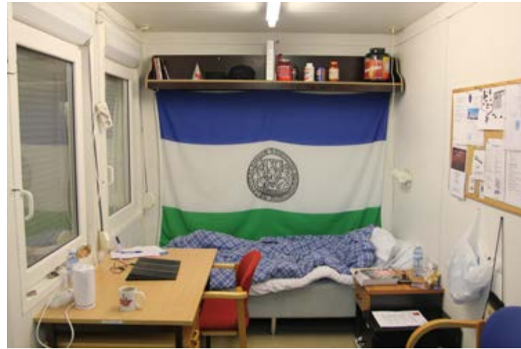
Interiörbild från bostadscontainern som den såg ut i Kosovo.

Alla föremål som hade tillhört soldaten i fråga samlades emellertid in till Armémuseums samlingar. Bland de 266 föremålen finns allt ifrån jordnötter, kaffe och plastblommor, till tandkräm, fotfilmar, nallebjörnar och doftljus. Det är föremålstyper som inte är särskilt vanliga i Armémuseums samlingar i övrigt. Som museiföremål får de en särskild status som kulturarv och blir en del av allt det som ska vårdas, visas och bevaras för framtiden, tillsammans med kanoner, uniformer och medaljer i samlingarna. I utställningen visas alla föremål som kommer från förläggningen i självförslutande plastpåsar, resten är