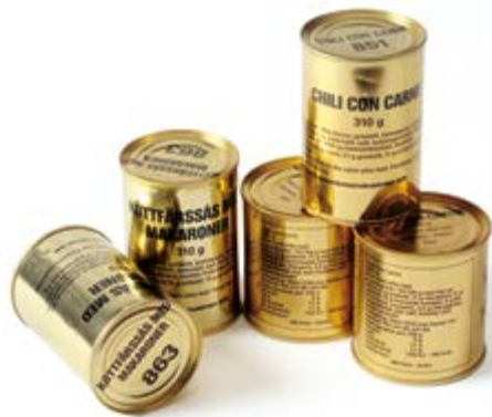
Konservburkarna är ett exempel på en typ av föremål i Armémuseums samlingar som har kontextualiserats med hjälp av personliga minnesbilder.

föremål har kanske använts av någon, men det går nästan aldrig att ta reda på av vem, när, var eller hur. Det är självklart något som sätter begränsningar för Armémuseums verksamhet, samtidigt som det också ger museet stor frihet att välja vad det ska berätta om föremålen i samlingarna.