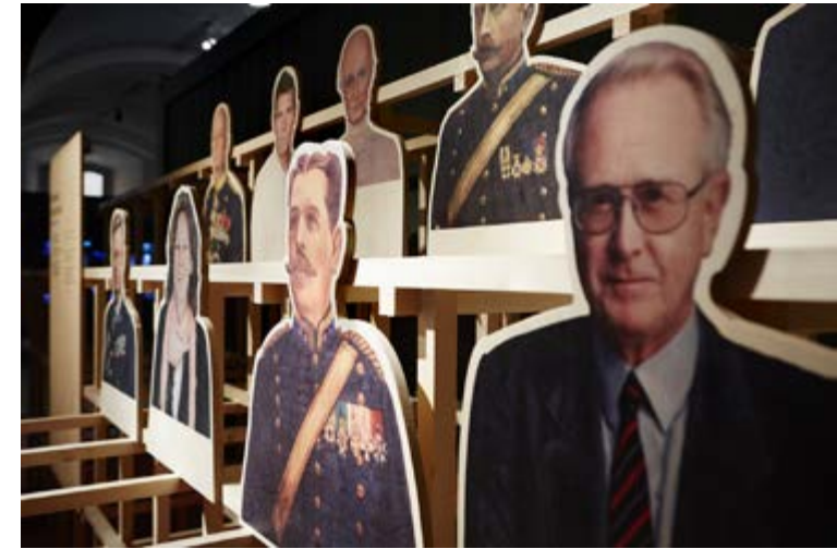
Porträttbilder på Armémuseums forna museichefer i utställningen Makten och ärligheten .

Säkerligen har Armémuseum mycket att vinna på att tänka mer normkritiskt kring sina samlingar. När det gäller militärhistoria låg fokus väldigt länge på att skildra de vuxna männens deltagande i krig. De flesta föremålen i Armémuseums samling har därför skapats för och använts av män. I de delar av samlingen som kan kopplas till olika namngivna personer dominerar de högre klasserna, adelsmännen och officerarnas ägodelar. De utnötta manskapsuniformerna är sedan länge borta, slängda eller återanvända till annat. Mycket få föremål kan berätta något om hur kvinnor och barn påverkades av krig, eller om de män som inte bedömdes som tillräckligt dugliga för att delta. Det finns inga