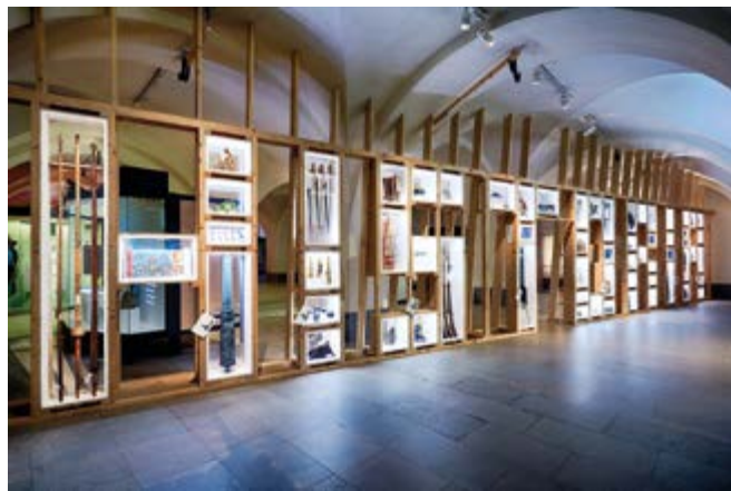
Historieväggen i utställningen Makten och ärligheten på Armémuseum.

Det utbredda intresset för vad museer samlar och väljer bort är säkerligen något betecknande för samtiden. Inom museisektorn finns idag en större medvetenhet om att museer inte bara förvaltar kulturarv, utan också aktivt skapar kulturarv och brukar museisamlingar för att kommunicera olika berättelser. I oktober 2015 öppnade Armémuseum Makten och ärligheten , en del av museets basutställning som problematiserar museers makt att välja vad som ska sparas och berättas om de föremål som finns i samlingarna. Makten och ärligheten är resultatet av Armémuseums självkritiska granskning av insamlingsverksamheten genom historien, men också ett försök att få museets besökare att börja fundera på hur det kommer sig att vissa saker sparas på museum och andra saker glöms bort.