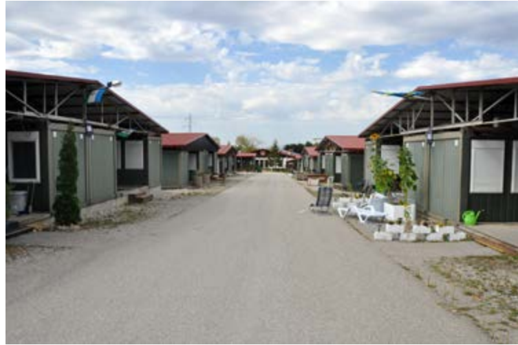
Gatuvy i ett bostadsområde på förläggningen Camp Victoria, Kosovo.

vanlig radhusgata i Sverige, med planteringar, flaggor och solstolar. Bostadscontainrarna gav således en intressant inblick i hur soldaterna skapade en personlig hemmiljö på en militär förläggning där allt annars såg väldigt likadant ut.