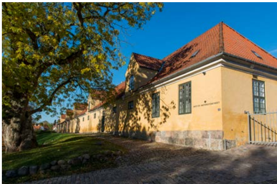
Danmarks Jagt- och skovbrugsmuseum var från 1942 till 2016 inrymt i ekonomibyggnaderna till Hørsholms slot på Själland från 1700-talet. Museet var platsspecifikt i den meningen att fenomen som behandlades i museiutställningarna gick att iakttä i landskapet i museibyggnadernas omedelbara närhet.

byggnader tömts. Ett exempel är Dansk Jagt- og Skovbrugsmuseum i Hørsholm norr om Köpenhamn, som stängde i december 2016 i samband med att museet fusionerades med Dansk Landbrugsmuseum på östra Jylland, dit alla samlingar flyttats. Museet i Hørsholm var beläget i byggnader som i sig utgör kulturminnen och besöksmål, och det var platsspecifikt, beläget i anslutning till ett område som 2015 blev förklarad som världsarv med hänvisning till det unika kulturlandskapet som fortfarande präglas av spåren efter en speciell metod för jakt som bedrevs under Christian IV:s tid på 1600-talet. En del av den berättelse om jakt och skogsbruk som museet förmedlade var avläsbar i landskapet precis utanför museibyggnaden. Detta förhållande var dock inte tillräckligt för att övertyga de politiker som såg möjliga besparingar och rationaliseringar av driften som ett överordnat intresse. Så av Dansk Landbrugsmuseum och Dansk Jagt- og Skovbrugsmuseum skapades den nya organisationen Det grønne museum, ett ämnesspecifikt museum vars syfte är att belysa naturbruk och agrara näringar, både jakt, skogsbruk och lantbruk. Stängningen av museet på Själland, och fusioneringen av de båda museerna, hade under 2015 och 2016 gett upphov till en debatt i dansk dagspress (Heltoft & Juul Nielsen i Politiken 2015-10-01).