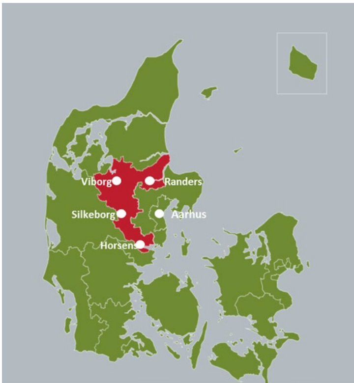
Figur 3 Kulturregion Østjysk Vækstbånd (Østjysk Vækstbånd [2011])