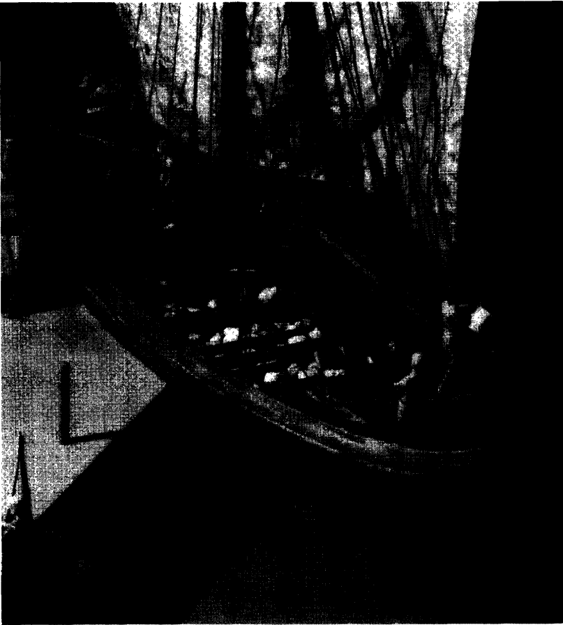
Figur 2. Modell av den såkalla Skuldelevkvarnen. Frå Andersen og Andersen 1989: 264.

hefilskaft om det skulle fungere, altså som hnykkistafr . Det er derfor ikkje urimeleg om hnykkistafr òg vart brukt til å krøke inn ting frå sjøen med. I så fall kan det ha vori same tingen som bátshaki , m., som den eine gongen det er nemnt i norrøne kjelder blir brukt til å fiske opp ein kar som har dotti i sjøen ( Hálfðanar saga Eysteinssonar : 263). Førelekken hnykki- i hnykkistafr stemmer likevel ikkje heilt med det, for ein kan ikkje rykke ein kar opp frå sjøen eller ein småbåt innåt eit skip. Kjeldene nemner òg ein jarnskodd stav om bord på mellomalderskipa: Forkr, jarnstafr, jarngaddr (Falk 1912: 26–27). Det ser ut til å ha vori noko anna enn både hefilskaft ( /hnykkistafr? ) og bátshaki , med di den jarnskodde staven i kjeldene berre blir brukt til å skuve frå med eller stikke med.