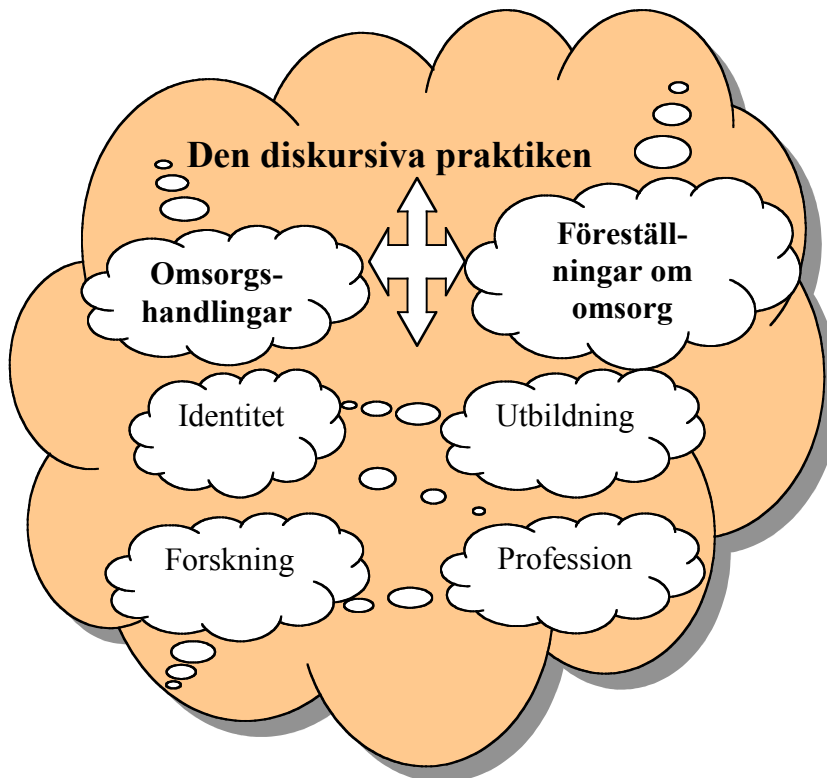
Figur 7.1. Omsorg som diskursiv praktik.