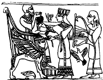
Fig. 1. Härskare på sin kerubtron. Scen från en elfbensplakett från Megiddo.

Den ena är den härskande Guden: «Herren Sebaot, han som tronar på keruberna». Det är ett namn med anknytning till ett specifikt kultföremål: templets tomma kerubtron (Fig. 1 och 2). Där sitter den osynlige Guden, och templet är mötesplatsen, kontaktpunkten, mellan himmel och jord. Sebaotskomponenten i Israels tro visar sig använda metaforik som det gamla Kanaan knöt till högguden El, känd från de ugaritiska texterna.