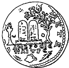
Fig. 3. Mynt från Tyros med avbildning av kultplats med stenstoder.

siktligt studium av nabateerna som bekräftade Patrichs slutsats att dessa hade anikonisk kult (återigen stelar). Nabateernas personnamn, namnen på deras gudar och en av deras två tempeltyper ledde vidare till folken på den arabiska halvön. Det visade sig att araberna före Muhammed hade anikonisk kult kring stående stenar i öppna friluftshelgedomar. Denna arabiska de facto-anikonism kröntes sen med ett proklamerat bildförbud inom islam under kalifen Yazid II (721 e.v.t.), alltså flera år före Leon II:s edikt år 726.