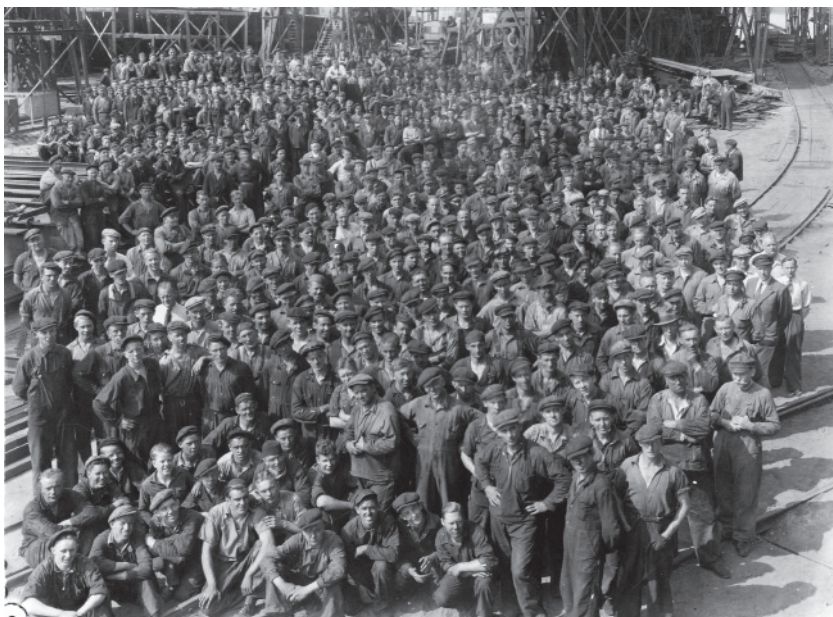
De anställda vid Öresundsvarvet i Landskrona uppställda för fotografering i slutet av 1930-talet.

närmast hegemonisk och maktfullkomlig politisk kraft med vidsträckta ambitioner och möjligheter när det gällde att söka forma och formulera ”vanligt folks” och arbetarklassens intressen och världsbilder. Men trots – eller kanske just på grund av? – detta, förefaller den stora landskronitiska arbetarklassen ha varit ovanligt mottaglig för främlingsfientliga strömningar vid flera tidpunkter i historien. Arbetarekommunen tycks då inte ha förmått agera effektivt motvikt eller ordinera några verkningfulla motmedel. 63 Vad som i detta sammanhang numera ofta glöms bort, och som blir tydligt i Landskrona, är betydelsen av arbetarklassens ekonomiska och politiska beroendesituation. Till följd av både det kapitalistiska lönearbetets principer, som försätter arbetarna i en konkurrensfylld och underlägsen position gentemot arbetsköparna, och ”den svenska modellens” samförståndsnormalitet riskerar röster som är kritiska och konfrontativa gentemot olika samhälleliga maktinstanser och dess ideologier att undertryckas snarare än att bemötas.