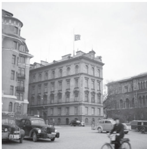
Tyska legationen på Blasieholmen i Stockholm i början på maj 1945.