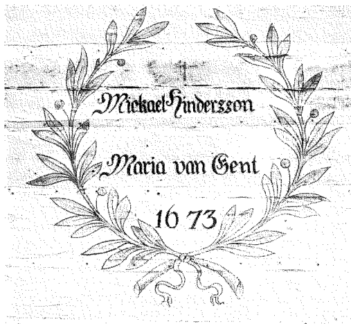
Medaljong på bortre gavelväggen i Laxbrostugans helgdagsstuga.